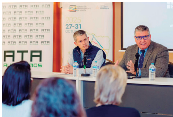
Sesenta autónomos participaron en la cita.

Más de 60 autónomos turiasonenses participaron en la charla, donde se abordaron las principales novedades y ventajas del sistema de facturación digital 'Verifactu'.