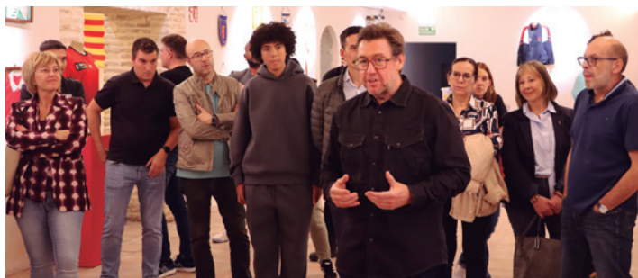
Inauguración de la exposición conmemorativa en San Joaquín.

Tarazona conmemora este año el 60 aniversario del Club de Rugby, fundado en 1965, un hito que destaca la relevancia histórica y social del deporte en la ciudad.