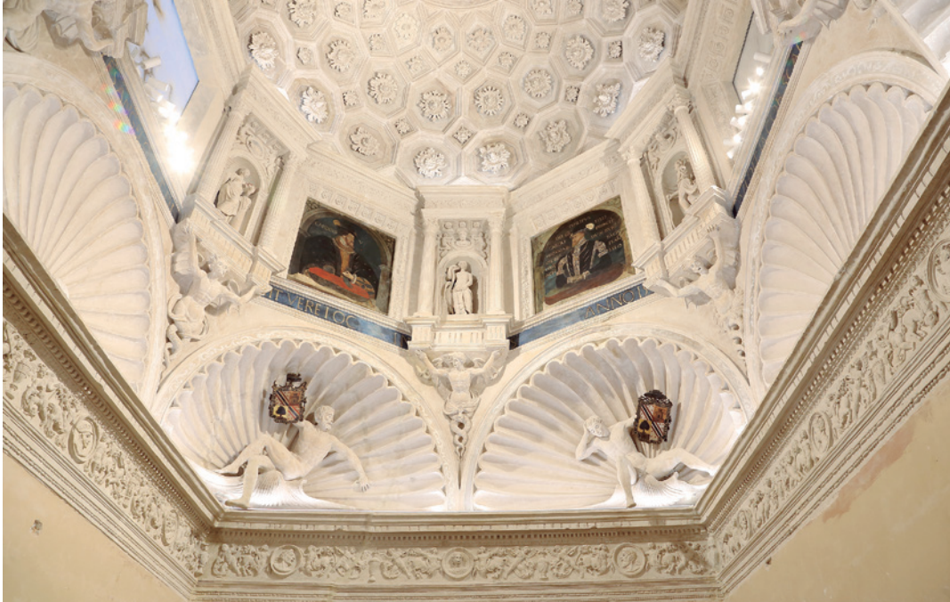
Aspecto de la cúpula tras la restauración.

Un reciente hallazgo ha sorprendido a los restauradores de la cúpula del palacio episcopal que han trabajado durante los últimos nueve meses en estas labores: la aparición de dos frisos del siglo XVI que habían permanecido ocultos durante siglos bajo capas de cal.