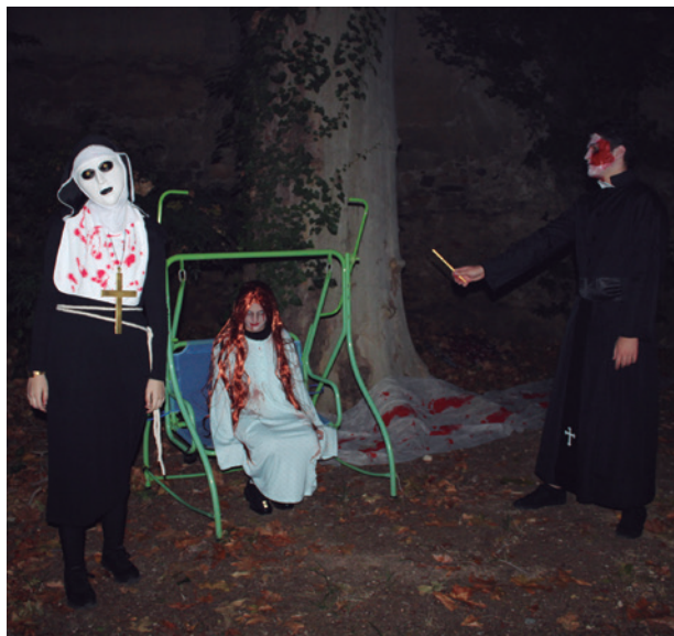
Algunos de los actores que se encargaron de asustar al público.