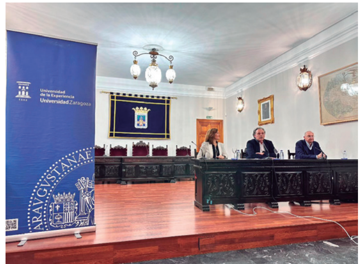
Inauguración en el salón de plenos del consistorio.

El curso se prolongará hasta mayo con un total de 120 horas lectivas repartidas entre las tardes de los martes, miércoles y jueves. Cuenta con seis asignaturas que analizarán por ejemplo la historia contemporánea de España centrándose en el siglo XIX, el patrimonio cultural, la historia de la pintura, el cerebro o la Corona de Aragón, entre otras cuestiones.