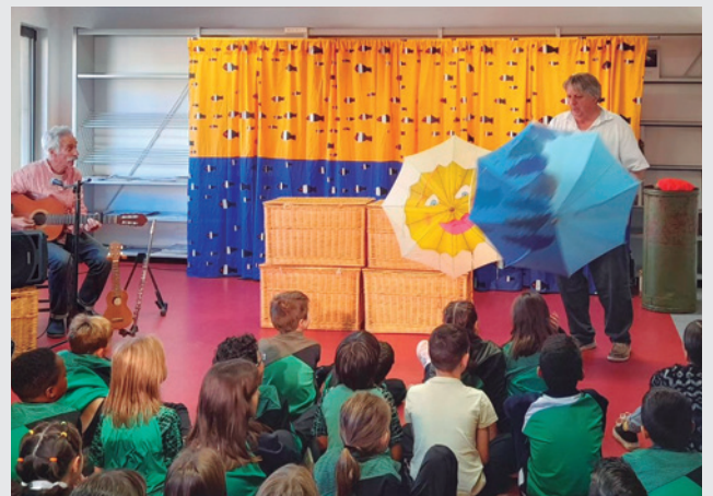
Cuentacuentos con música en la biblioteca.