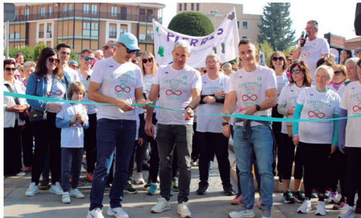
Los tres homenajeados cortaron la cinta inaugural.

El reto 24 horas junto al río Queiles comenzó con el home-