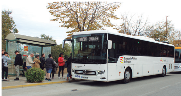
El nuevo autobús en la parada de la avenida Ciudad de Teruel.