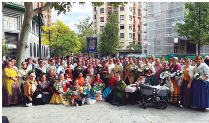
Grupo local presente en la ofrenda.