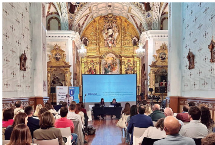
El convento de Santa Ana fue la sede de estas jornadas.