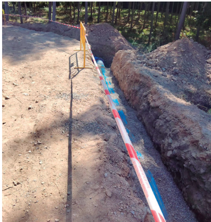
Nuevo tramo de tubería renovado.

Las fases I y II han permitido actuar en el tramo más deteriorado de la red, donde se producían averías con mayor frecuencia. La inversión total en esta fase II ha sido de 300.000 euros, y se ha financiado a través del Plan de Subvenciones