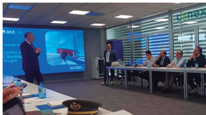
El alcalde tarazonense en la sesión de trabajo.

Posteriormente se realizó una sesión de trabajo en la que el delegado de Defensa en Aragón, el coronel Vitoriano Blanco Caraballo, presentó el convenio de colaboración suscrito entre la FAMCP y el Ministerio de Defensa, para impulsar la incorporación al ámbito laboral civil del personal perteneciente a las Fuerzas Armadas (FAS).