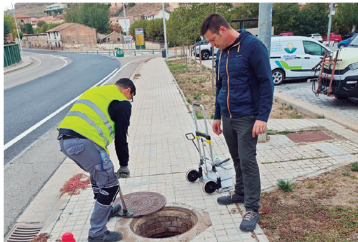
Actuación junto al aparcamiento de Eguarás.

La colaboración de todos los ciudadanos resulta esencial. Por eso el Consistorio hace un llamamiento para mantener la limpieza, evitando dejar restos de comida, e incide en la importancia de notificar cualquier incidencia para garantizar un entorno saludable.