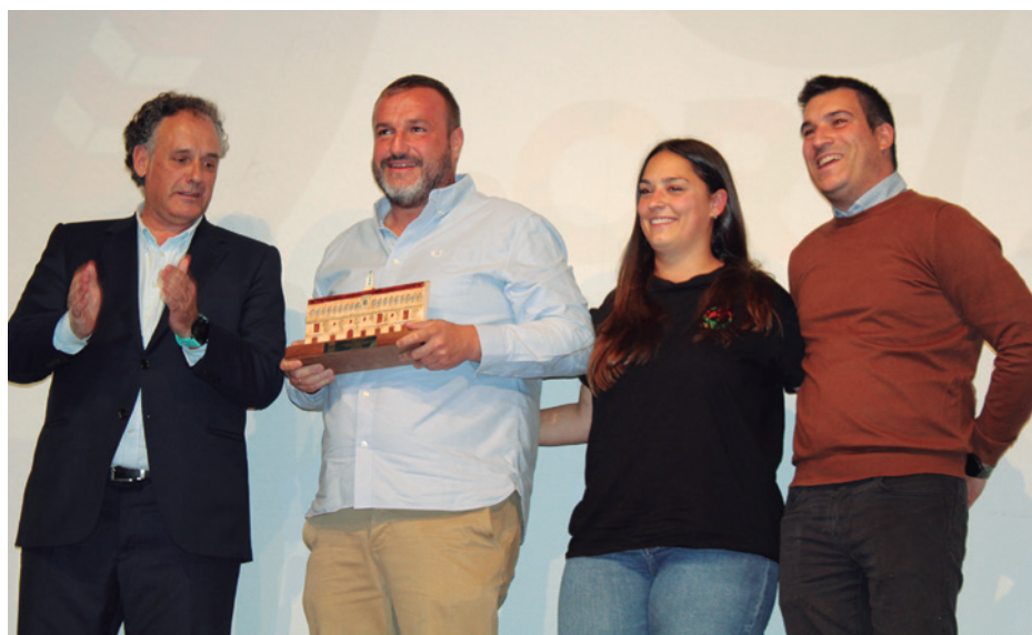
Homenaje al club de rugby en su 60 aniversario.