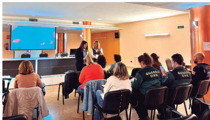
El taller se centró en la prevención en el medio rural.

Tarazona acogió el 21 de octubre el taller 'Brújulas contra la Violencia de Género', un proyecto del Gobierno de Aragón que busca adaptar la prevención y la atención frente a la violencia de género al entorno rural.