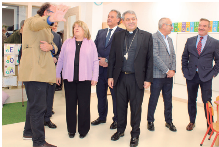
Conociendo una de las aulas de Educación Infantil.