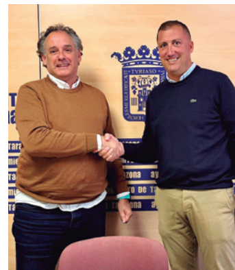
El alcalde y el presidente sellaron el convenio.

Por su parte, el presidente del club agradeció la firma del acuerdo ya que "para nosotros es muy importante renovarlo cada año y como club, es un motivo de orgullo difundir el nombre de nuestra localidad por toda la geografía española y hacerlo de forma desinteresada, con el esfuerzo y la pasión de todos los que formamos parte de esta familia".