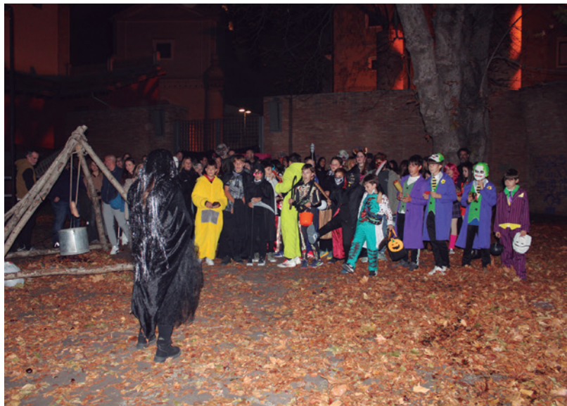
Numeroso grupo de niños y familias al inicio de su recorrido.

Halloween ha llegado para quedarse. La tarde noche del 31 de octubre multitud de disfraces terroríficos de niños y mayores se lucieron por las calles de Tarazona. Además, muchos bares, restaurantes y comercios