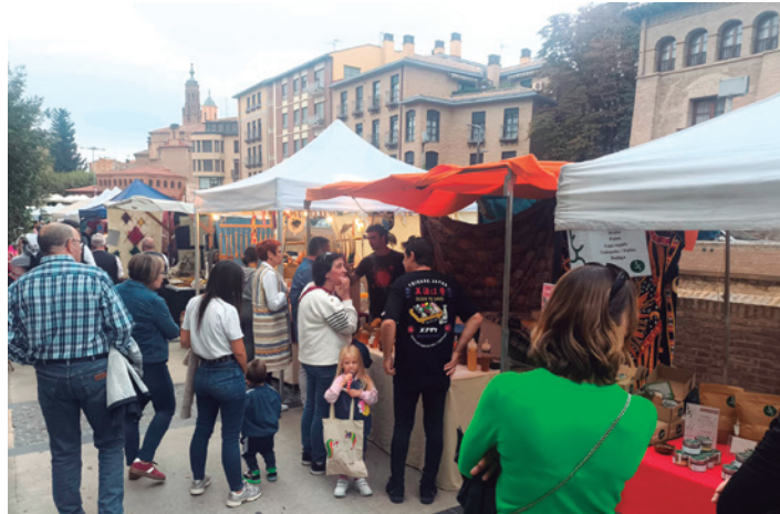
Los puestos de la feria dinamizaron el centro de la ciudad.

Durante tres días, la ciudad ofreció una amplia programación