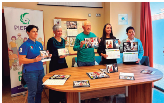
Presentación del calendario solidario.

La Asociación de Comercio, Servicios e Industria de Tarazona (ACT) ha colaborado con la asociación Pierres en la elaboración de su calendario solidario para el año 2026. Esta iniciativa sirve desde hace años para recaudar fondos que ayudan a Pierres a seguir desarrollando proyectos de inclusión para las personas con diversidad funcional.