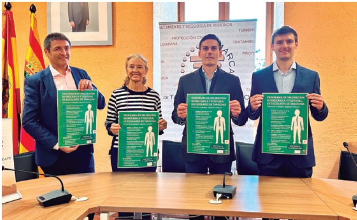
Escribano y representantes de BIPSA en la presentación.

La Comarca de Tarazona y el Moncayo, en colaboración con el Ayuntamiento de Tarazona, los centros educativos de la zona y la empresa BIPSA especializada en bioingeniería, postura y salud, pone en marcha un proyecto pionero de salud escolar que permitirá