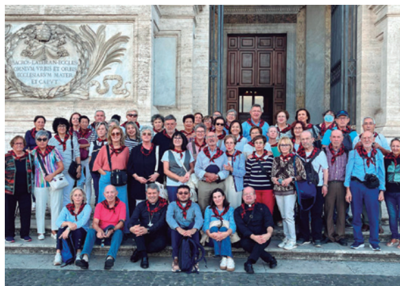
Los peregrinos durante su estancia en Roma.

cuatro basílicas mayores —San Pedro, San Pablo Extramuros, San Juan de Letrán y Santa María la Mayor— para ganar el Jubileo. El programa incluyó celebraciones eucarísticas en templos emblemáticos, la participación en la audiencia papal, y visitas culturales a iglesias históricas, monumentos y plazas de Roma.