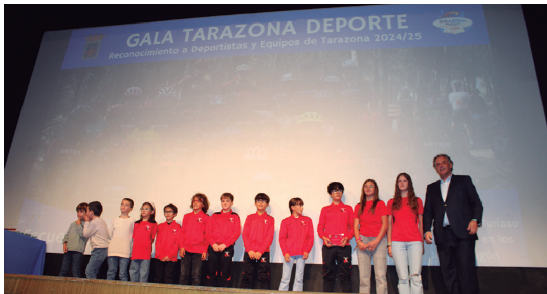
Reconocimiento a la escuela ciclista.

El Ayuntamiento de Tarazona celebró el 24 de octubre en el teatro Bellas Artes la primera edición de la Gala Tarazona Deporte, un evento con el que se rindió homenaje a los deportistas, equipos y clubes locales por los logros deportivos obtenidos durante la temporada 2024/2025. En total, fueron reconocidos cerca de un centenar de deportistas pertenecientes a trece modalidades deportivas, entre