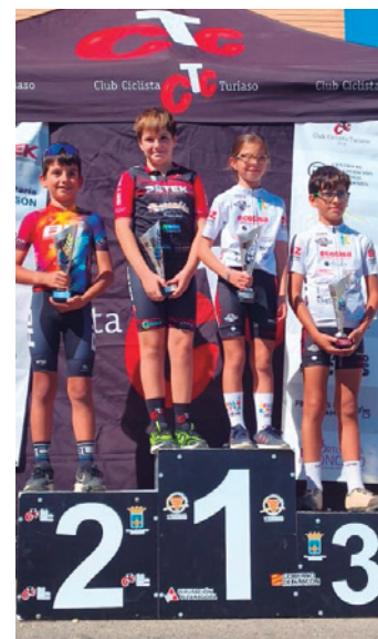
Uno de los podios con ciclistas turiasonenses.

Por su parte, la prueba para escuelas con categorías inferiores constó de una prueba de habilidad y de una prueba