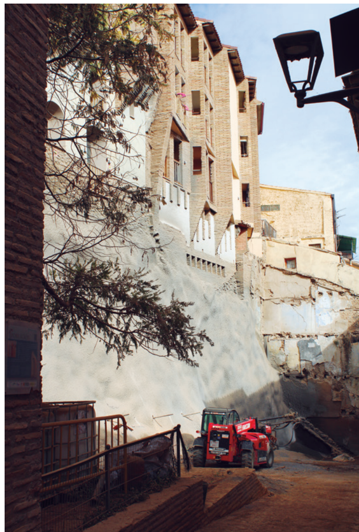
El hormigón proyectado cubre ya toda la base de las Casas Colgadas.

Estas actuaciones cuentan con el apoyo del Gobierno de Aragón y de la Dirección General de Patrimonio Cultural. Los contratos de emergencia ascienden hasta ahora a más de 700.000 euros.