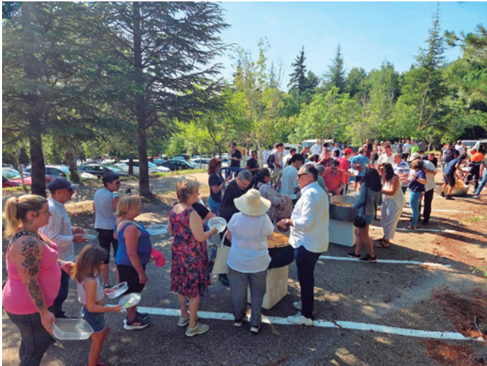
El reparto de migas en Agramonte fue multitudinario.

Tarazona celebró el domingo 6 de julio una de las tradiciones más queridas y centenarias de la ciudad, la romería del Quililay. Los romeros completaron el camino a pie, en bicicleta o a caballo, manteniendo viva la esencia de este día tan especial.