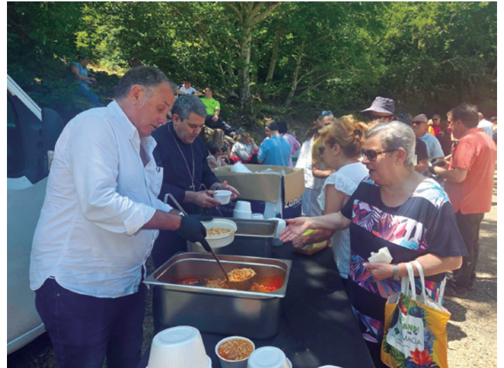
No faltaron las tradicionales judías en Moncayo.

la Huerta. El siguiente punto importante de la programación fue el reparto de las tradicionales migas a la pastora en Agramonte. Preparadas por la Brigada Municipal, volvieron a ser un gran éxito y cientos de personas recogieron su ración. El alcalde y miembros de la Corporación Municipal, así como el obispo de la diócesis