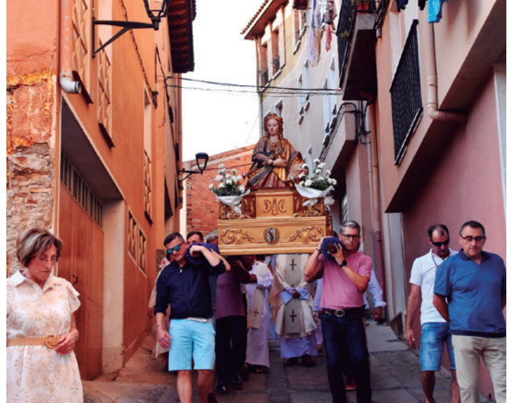
Procesión con la imagen de Santa María Magdalena.

En el barrio de El Cinto las fiestas en honor a Santa María