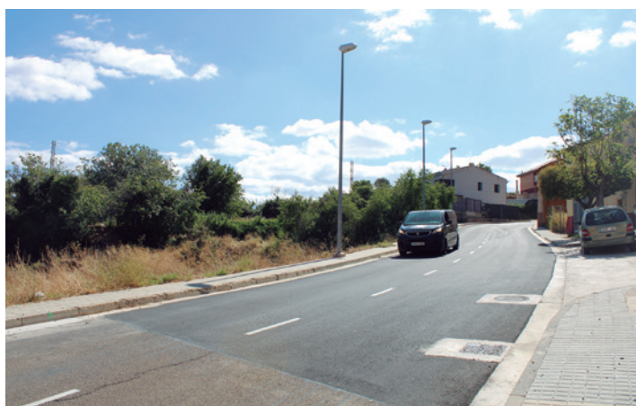
El nuevo asfaltado señala una de las zonas de actuación.

Los tarazonenses pueden circular con normalidad por la Cuesta del Crucifijo desde que a mediados de julio finalizara la obra de renovación de la red de abastecimiento.