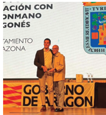
Escribano recogió el premio del Ayuntamiento.

Además, la agrupación deportiva Balonmano Tarazona recogió varios premios por los éxitos deportivos conseguidos