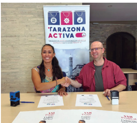
La presidenta de ACT y el director del Festival sellaron el acuerdo. (ACT)

La Asociación de Comercio, Servicios e Industria de Tarazona (ACT) firmó el pasado 16 de julio el convenio de colaboración con el Festival de Cine de Comedia de Tarazona y el Moncayo 'Paco Martínez Soria', que éste año celebrará su XXII edición del 16 al 23 de agosto.