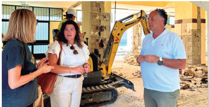
Visita al área donde se han iniciado los trabajos.

Se va a instalar un elevador que permitirá independizar los accesos entre usuarios y espectadores, mejorando así la funcionalidad y la organización de los flujos dentro del recinto. Supone además un gran avance en mate-