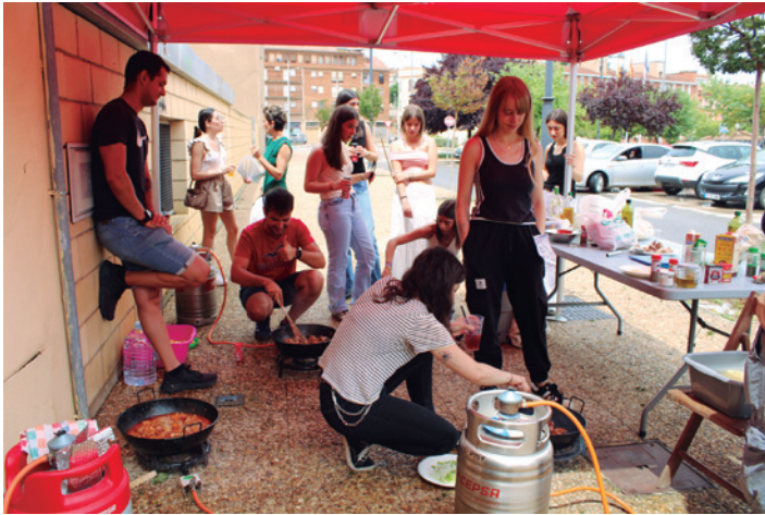
Preparando los ranchos para el concurso.

La asociación Bendita Juventud valora de manera positiva la primera edición de las Fiestas de la Juventud de Tarazona. La cita tuvo lugar el sábado 12 de julio, y aunque hubo que trasladar de ubicación las actividades por la DANA del día anterior y la