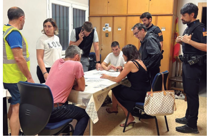
Coordinación de emergencias en los primeros instantes tras la tormenta.

El Ayuntamiento coordinó desde el primer momento la actuación de Bomberos de