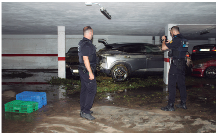
Agentes de la Policía Local en el garaje inundado del paseo el día 12.