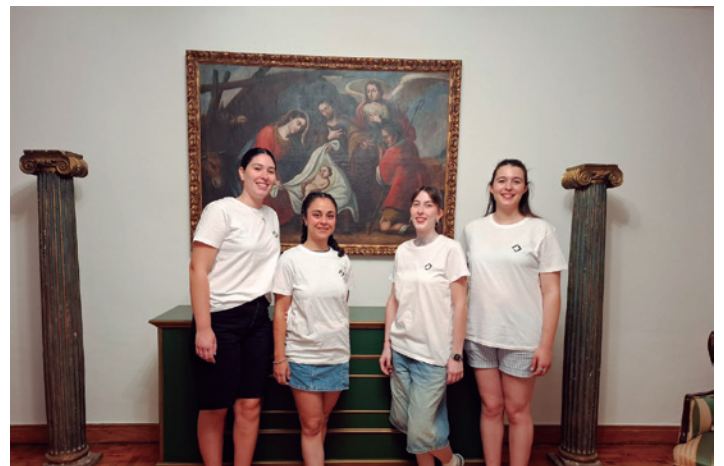
Estudiantes participantes en la campaña de este año.

La Casa del Traductor fue su alojamiento durante su estancia, gracias a la colaboración del Ayuntamiento de Tarazona, y pudieron conocer la ciudad y el entorno de comarcal.