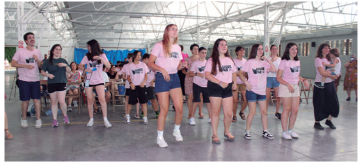
Música y baile en el primer concierto del festival.

El Seminario de Tarazona acogió del 2 al 6 de julio la segunda edición del Baquetar, el festival de percusión que comenzó el año pasado en la ciudad con una gran acogida. La respuesta esta vez también fue muy positiva, con 33 participantes, estudiantes de percusión, de 8 a 19 años de edad.