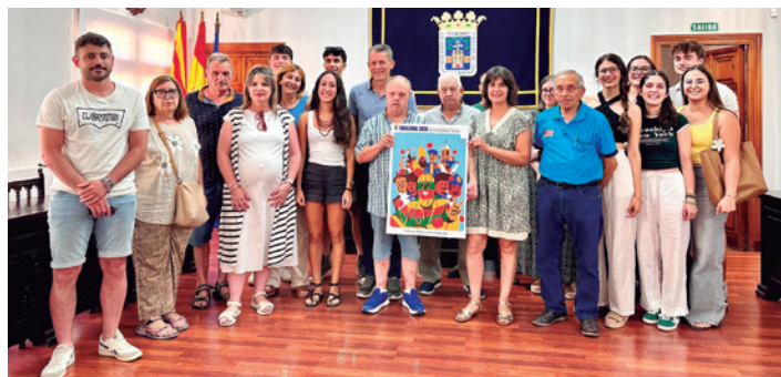
El jurado posando con el cartel ganador.

El cartel ganador reúne a algunas de las figuras más representativas de las fiestas de Tarazona como el Cipotegato, San Atilano -patrón de Tarazona-, el