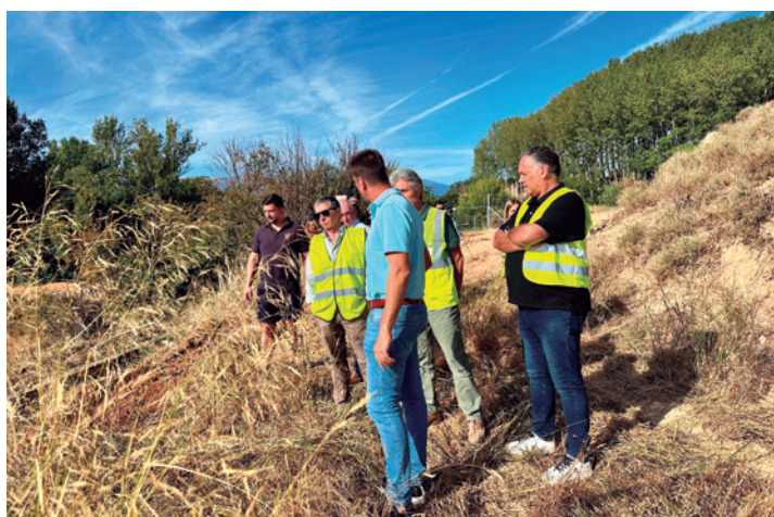
El director de Desarrollo Rural recorrió los campos afectados.