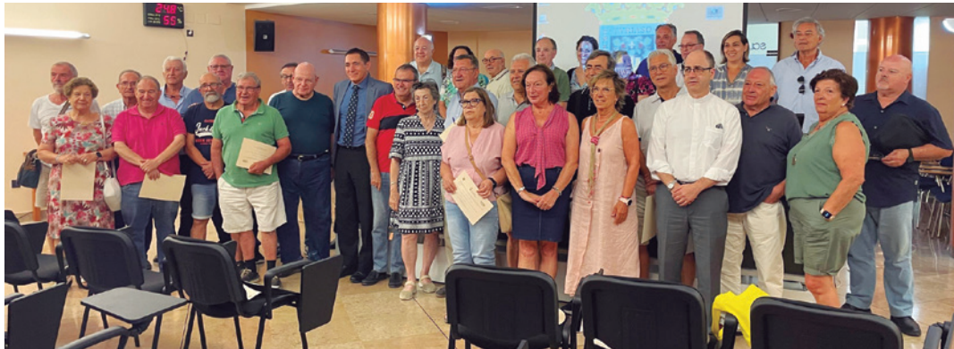
Imagen para el recuerdo de los asistentes al curso.

Más de cuarenta personas participaron en la 21 edición del curso de verano 'Ciudad de Tarazona', que este año se celebró del 14 al 16 de julio analizando el tema 'Aragón y los 50 años de democracia en España (1975-2025)'.