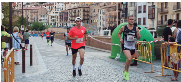
Corredores en pleno esfuerzo durante la carrera.

Más de doscientas personas participaron el pasado viernes 4 de julio en la segunda edición de la carrera RUNYTAPA. La cita, que unió deporte y gastronomía, fue organizada por el