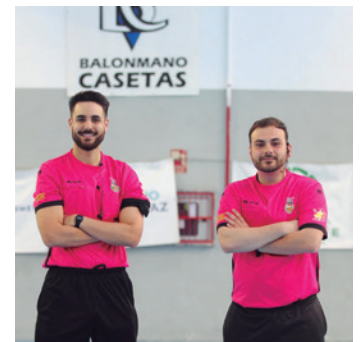
Los dos árbitros que ascienden a categoría nacional.

A finales de agosto asistirán al Stage Nacional de Pretempo-