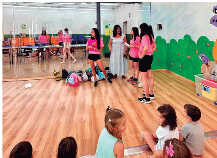
Primera jornada en la ludoteca municipal.

Los talleres de verano cuentan con la participación de 309 niños en julio y 169 en agosto,