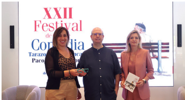
La presentación fue en Zaragoza el día 31.

El Festival de Cine de Comedia de Tarazona y El Moncayo 'Paco Martínez Soria' da un paso más hacia su XXII edición anunciando su programación. Fue presentada el 31 de julio en rueda de prensa en el espacio Ibercaja Xplora de Zaragoza.