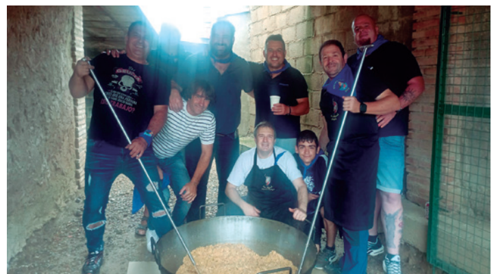
Preparando las migas en la plaza.

Se mantuvo la comida de hermandad en la plaza de toros de Tarazona, con la sobremesa amenizada por dj Juan Carlos. Los niños presentes pasaron una tarde muy entretenida gracias a los juegos y manualidades preparados por los monitores del Centro de Ocio Infantil 'Canguro'.