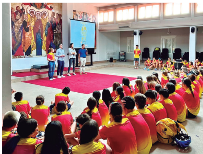
Recepción oficial en el Seminario.