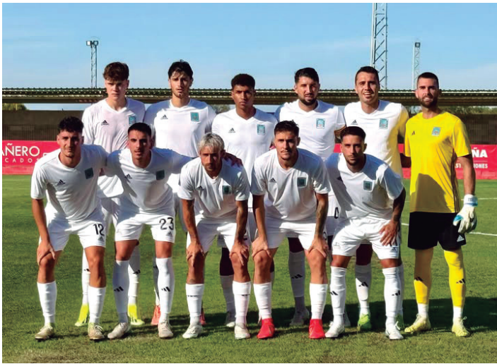
Primer once de la pretemporada frente al Huesca.

La Sociedad Deportiva Tarazona ya ha vuelto a los entrenamientos con una plantilla renovada con la que toca traba-