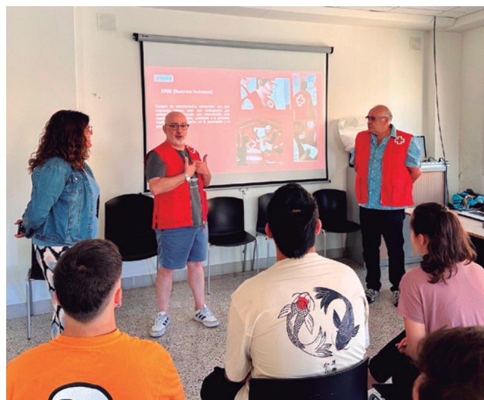
La antigua biblioteca acogió la presentación.

La formación, impartida por Cruz Roja, comenzará a partir del mes de septiembre. Aquellas personas interesadas en formar parte del ERBE, pueden acudir directamente a la Asamblea Local de Cruz Roja en Tarazona, donde se les facilitará toda la información.