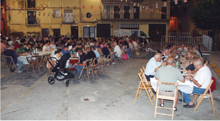
Cena popular en la plaza de la Almehora el sábado 19.

Los barrios turiasonenses de la Almehora y El Cinto animaron el verano en la ciudad gracias a la celebración de sus fiestas y su variada programación con citas tradicionales, culturales y de ocio.