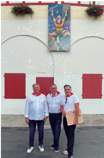
El Cipotegado luce así en la plaza de toros francesa.

ciación, procesión y santa misa cantada por el coro parroquial. Varios miembros de la Corporación Municipal acompañaron a los vecinos en la tradicional procesión con la imagen de la santa y después todos juntos degustaron las tradicionales magdalenas ofrecidas por la cofradía. Los fuegos artificiales pusieron el punto final a esta jornada especial.