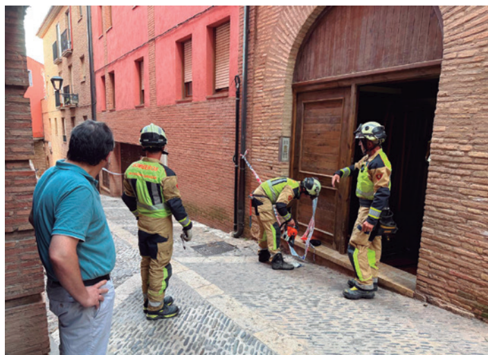
Los bomberos accediendo al edificio por la calle Conde.

El Ayuntamiento de Tarazona se vio obligado a desalojar por precaución un total de once familias de las Casas Colgadas y calle adyacente debido al desprendimiento de rocas que sufrió la peña sobre la que se asienta el edificio la madrugada del lunes 14 de julio. Desde el primer momento el acceso a las viviendas quedó restringido por seguridad y se atribuyó como causa del suceso las intensas lluvias de la DANA del viernes 11.