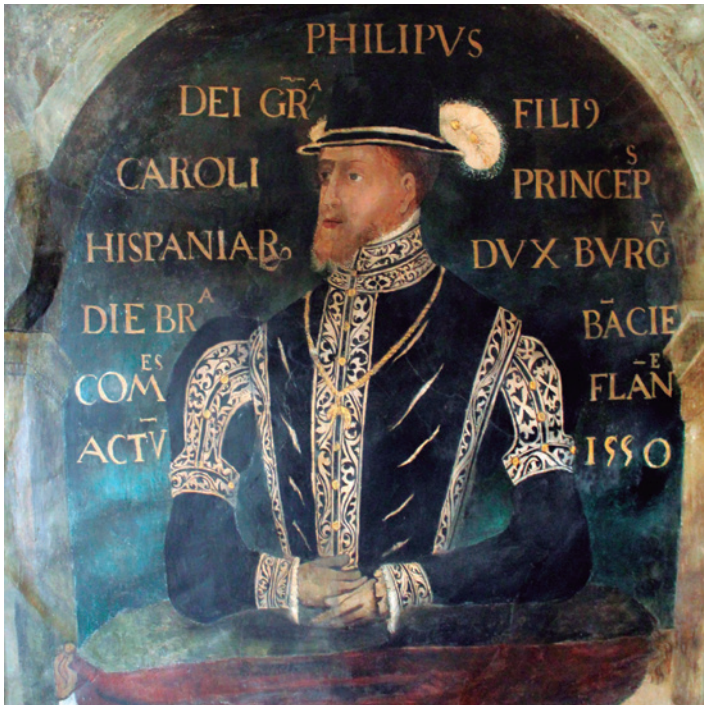
Uno de los tres retratos restaurados.

La Fundación Tarazona Monumental (FTM) finalizó la segunda fase de restauración de la escalera noble del palacio episcopal, centrada en las pinturas murales situadas en el tambor y en los escudos de madera del promotor que portan las esculturas de las veneras.