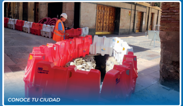
CONOCE TU CIUDAD

Nota: El equipo de redacción no se hace responsable de las opiniones que libremente manifiestan sus autores acogidos al derecho de libertad de expresión. Asimismo, autoriza a reproducir parcial o totalmente las informaciones aparecidas en este medio