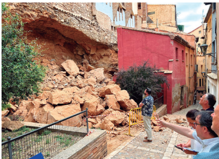
Se desprendieron grandes rocas de la peña.

El Gobierno de Aragón acometerá unas obras de emergencia para reforzar la peña bajo el edificio