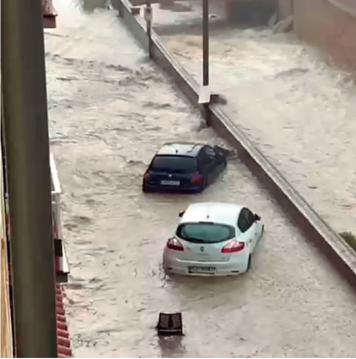
El paseo de la Constitución, completamente inundado.

La rápida coordinación de los servicios de emergencias evitó consecuencias graves