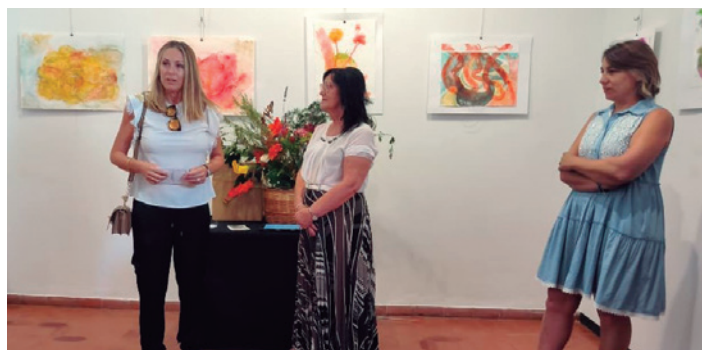
La artista con las concejales durante la inauguración.

vecinos y amantes del arte quisieron acompañar a la artista en el acto de inauguración, en el que también estuvieron presentes miembros de la Corporación Municipal.