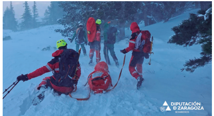
Los bomberos durante el rescate efectuado.

Hasta el lugar del accidente se trasladaron dotaciones de los parques de bomberos provinciales de Tarazona y de Ejea de los Caballeros para llevar a cabo las labores de rescate. En el operativo también participó la Guardia Civil y el 061.