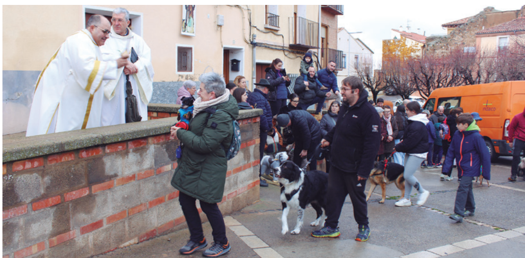
Tradicional bendición de animales en San Miguel.