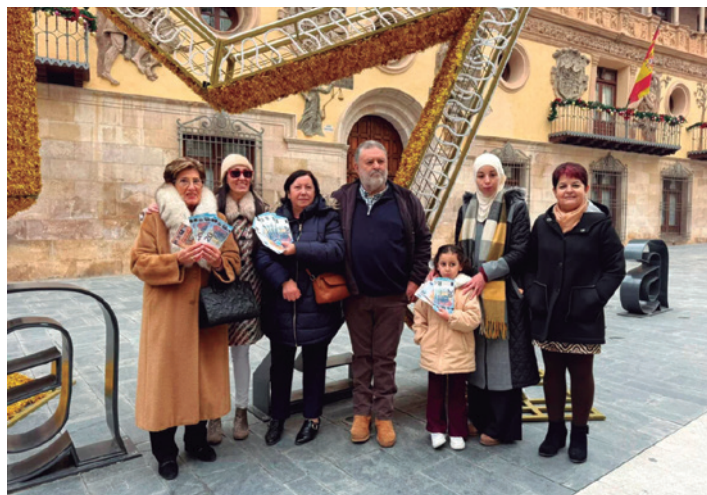
Posando con los ganadores de la campaña. (ACT)

La campaña contó con la colaboración de Caja Rural de Aragón, que aportó 300 euros para ayudar a sufragar parte de los premios. Desde ACT agradecen al público su confianza y le animan a seguir apostando por el comercio local... comercio amigo que une ilusión, tradición y vida para la ciudad.