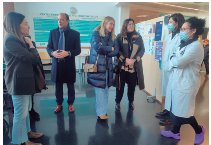
El consejero durante su visita al centro de salud.