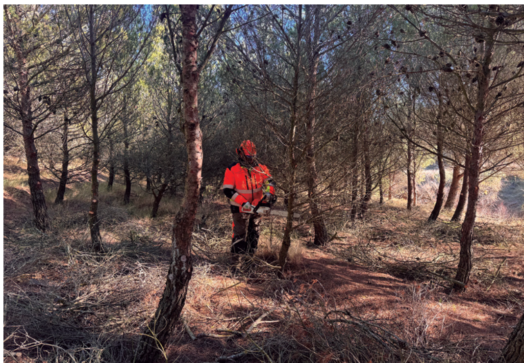
La poda se ha realizado en Monte Cierzo.

La Brigada de Montes ha llevado a cabo una poda en los pinares de Monte Cierzo para la eliminación de la vegetación que está en contacto con el suelo. Esta iniciativa tiene una finalidad preventiva, ya que así se puede evitar la propagación del fuego ante posibles incendios forestales.