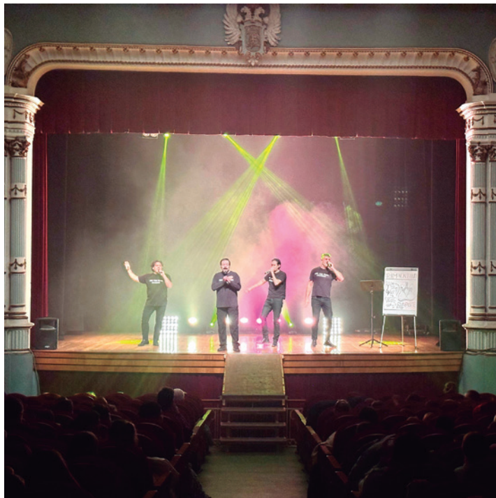
El grupo durante su actuación para los niños.