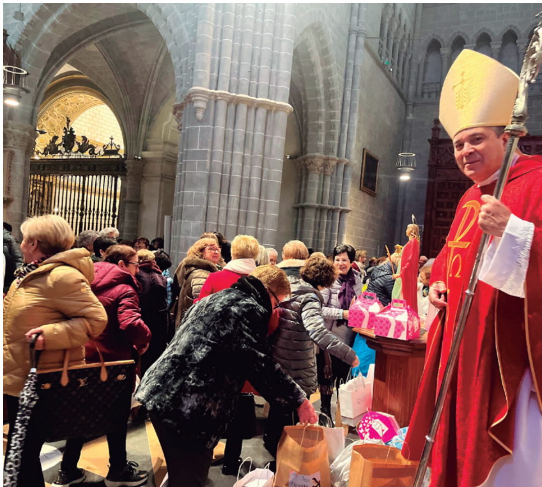
El obispo durante la celebración religiosa.

Además, el salón del Centro de Mayores acogió por la tarde un desfile de moda turiasonense seguido una sesión de baile en línea. El comercio turiasonense ofreció un tentempié dulce, con sorteo de regalos incluido, para todas las asistentes.