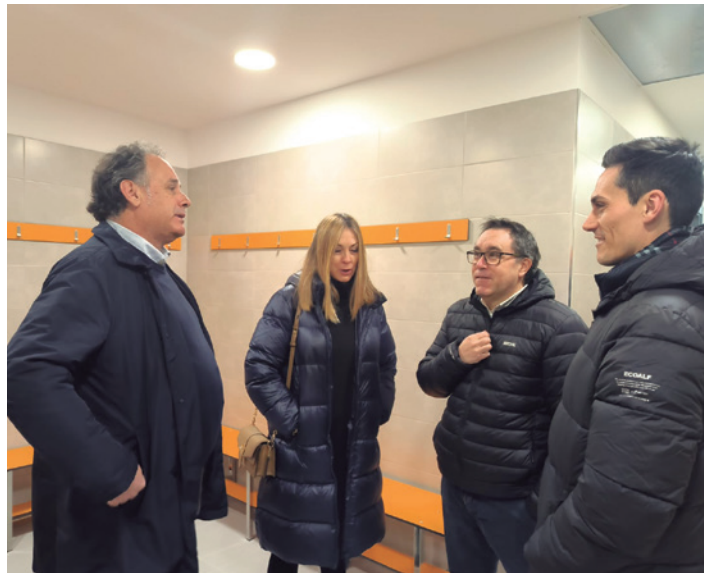
Durante la visita pudieron conocer todas las novedades.

La inversión supera los 750.000 euros que se han destinado a las siguientes actuaciones: reforma de los vestuarios, instalación de un ascensor para favorecer el acceso a personas con movilidad reducida, instalación de placas solares fotovoltaicas, renovación del sistema de climatización de la piscina cubierta para mejorar la eficiencia energética, e implementación de mejoras de digitalización para control de accesos y retransmisión de eventos deportivos.