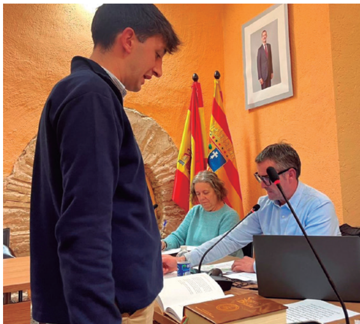
El nuevo consejero comarcal de Fomento y Empleo.

La Comarca de Tarazona y el Moncayo aprobó el presupuesto comarcal para el año 2026, que asciende a 3.405.502,15 euros. La sesión plenaria tuvo lugar el pasado 26 de enero y, entre otros