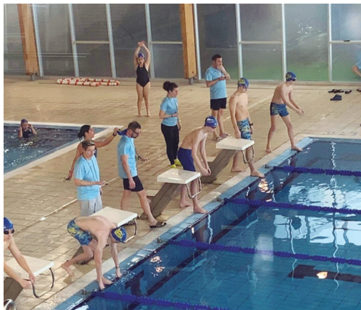
Nadadores a punto de comenzar una de las pruebas.

Organizado con la colaboración de Natación Salvamento Tarazona y las entidades participantes, el evento busca promover la práctica de este deporte y reforzar los lazos entre municipios a través de la competición y el compañerismo.