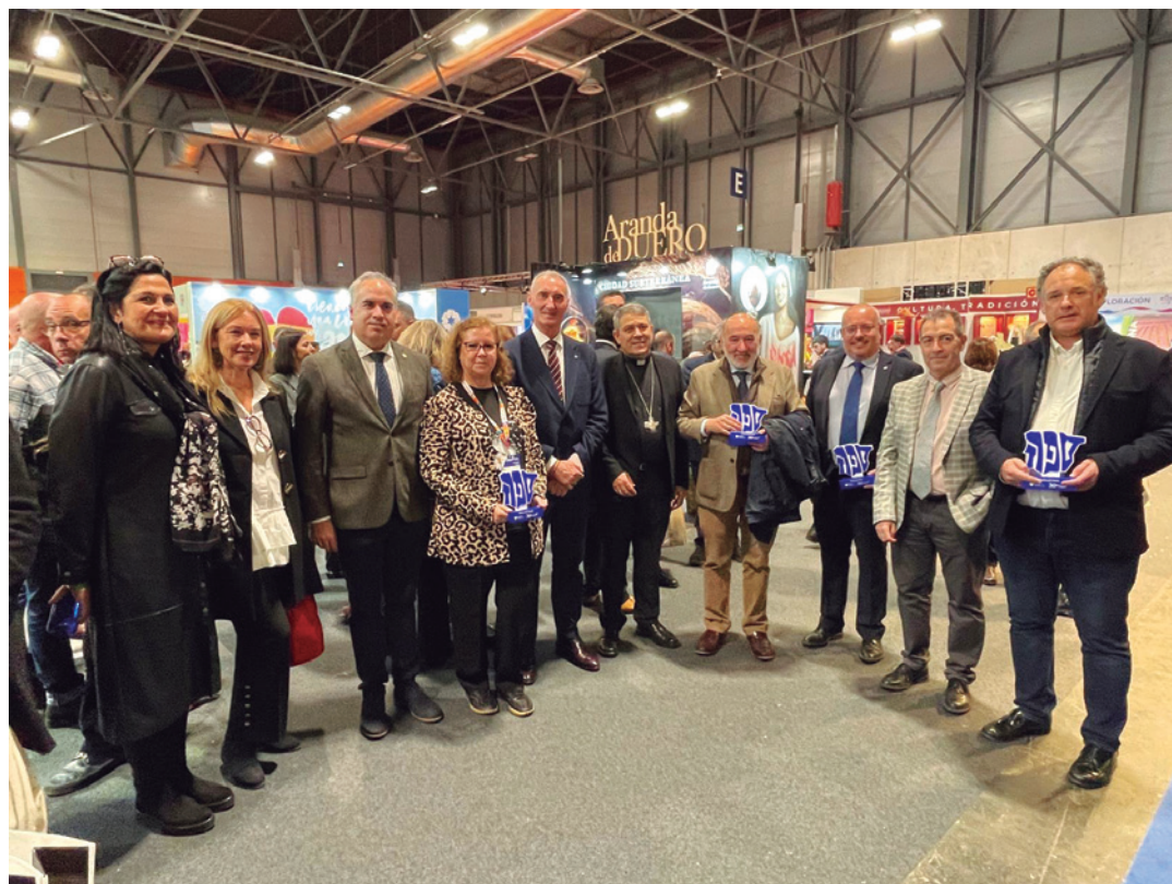
Autoridades presentes en Fitur el Día de Aragón.

'Aragón es el color, tú decides el viaje' es el lema con el que se presentó la comunidad en Fitur y con el que se pretendía apelar a las emociones del visitante. La visita se podía realizar desde una plaza central y cinco puntos de atención circular que funcionaban como nodos temáticos divididos por colores. Cada uno de ellos se apoyaba en recursos digitales y sensoriales que reforzaban la inmersión. El proyecto incorporaba pantallas táctiles y tabletas de información turística, así como un tótem digital de dos