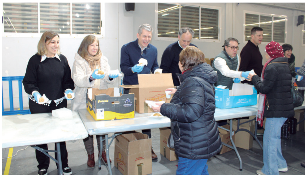
Reparto de patatas en el recinto ferial.