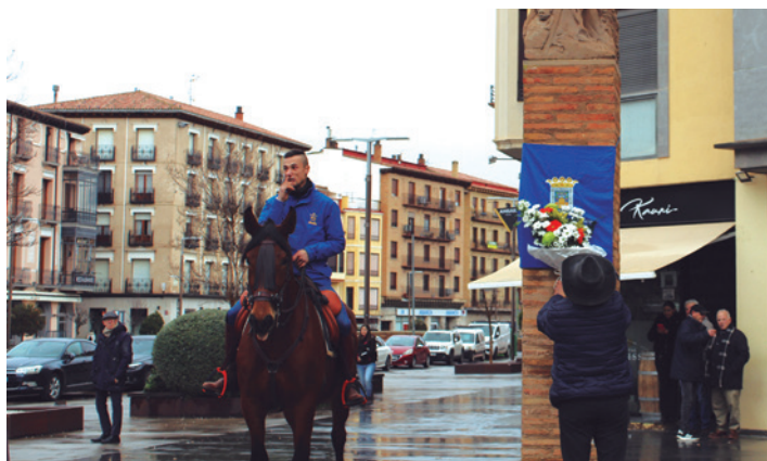
Ofrenda floral de los caballistas en el pilar del santo.

rado en la plaza de Toros Vieja y el Ayuntamiento ya informó por la mañana esta alteración del programa y de un cambio de ubicación, ya que la degustación de las patatas asadas fue trasladada al recinto ferial.