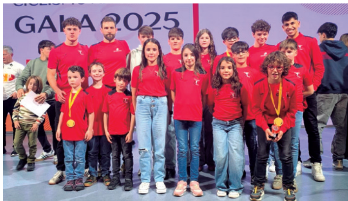
Miembros del club presentes en la gala.

La Federación Aragonesa de Ciclismo celebró el viernes 30 de enero la Gala del Ciclismo 2025, una cita que sirve para resaltar la labor de los deportistas, clubes, familiares, patrocinadores y público, practicando