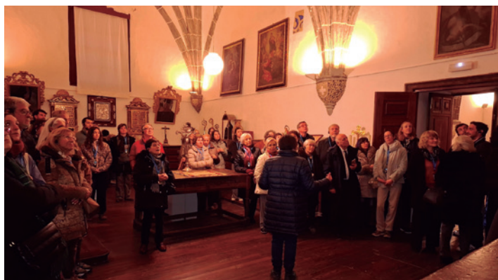
Público en el interior de la catedral durante la visita.

La Fundación Tarazona Monumental ha comenzado su agenda cultural del año 2026. Cada mes será posible disfrutar del patrimonio histórico, artístico e inmaterial de forma original y atractiva.