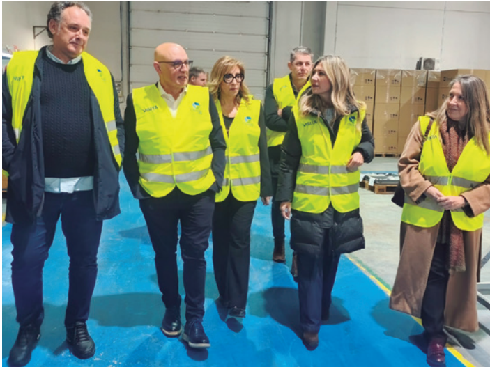
La vicepresidenta de Aragón asistió a la presentación.

La empresa Chemik, con sedes en Tarazona y Zaragoza, presentó su nueva línea de actividad vinculada al mercado de los centros de datos, un sector estratégico en pleno crecimiento, así como su apuesta por el empleo