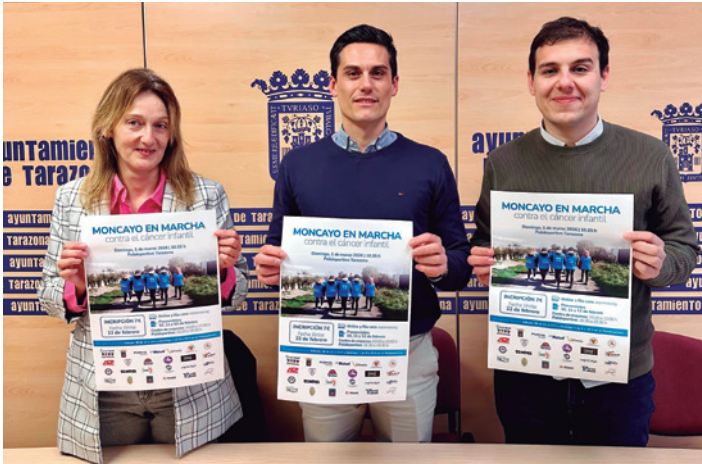
Presentación de la próxima marcha solidaria.

Tarazona acogerá el próximo 1 de marzo la cuarta edición de la Marcha Moncayo, una andada solidaria de 4 kilómetros por la Vía Verde del Tarazonica, con salida y llegada en el polideportivo municipal. La iniciativa se organiza a beneficio de la Asociación de Padres de Niños con Cáncer de Aragón (Aspanoa).