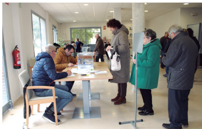
Turasonenses votando en la residencia Palmerola.

El 13 de enero se celebró el pleno extraordinario para el sorteo de las mesas electorales de los comicios autonómicos. Además, el 8-F el Ayuntamiento ofreció un servicio gratuito de transporte para personas con movilidad reducida, para ir a votar y volver a casa, coordinado