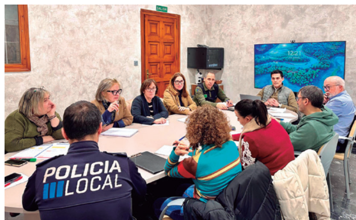
Diferentes departamentos están implicados en los preparativos.