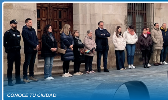
CONOCE TU CIUDAD

Nota: El equipo de redacción no se hace responsable de las opiniones que libremente manifiestan sus autores acogiéndose al derecho de libertad de expresión. Asimismo, autoriza a reproducir parcial o totalmente las informaciones aparecidas en este medio