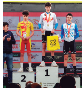
El ciclista cadete con la medalla de plata.