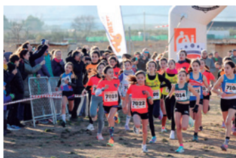
El equipo turiasonense, de naranja, en plena competición.

La localidad de La Almunia de Doña Godina acogió el 11 de enero el Campeonato de Aragón de atletismo en modalidad cross con la presencia de multitud de atletas aragoneses, entre ellos varios corredores del club Atletismo Tarazona. Se disputó la prueba en formato individual y por equipos.