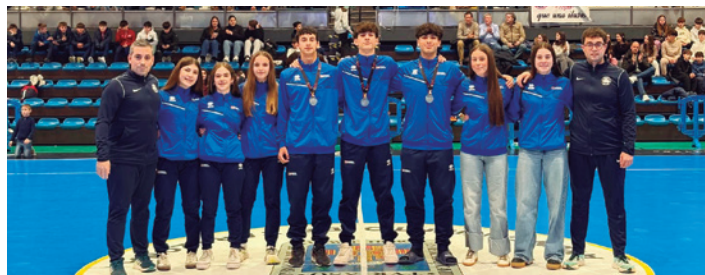
Los jugadores recibieron la ovación del público.