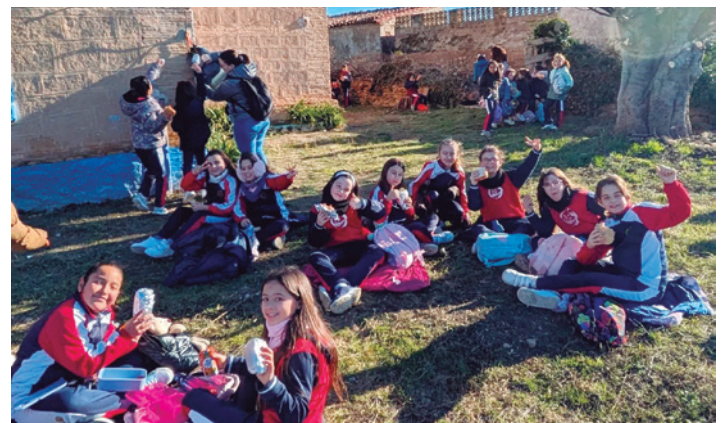
Escolares en la ermita con su almuerzo.