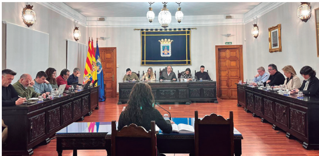
Sesión plenaria celebrada el pasado 28 de enero.

El alcalde hizo balance en el pleno destacando las mejoras urbanas, en servicios y patrimonio