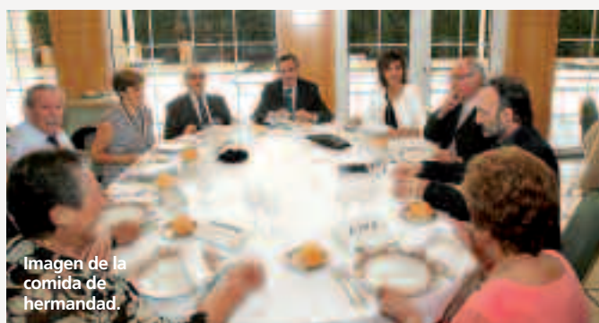
Imagen de la comida de hermandad.