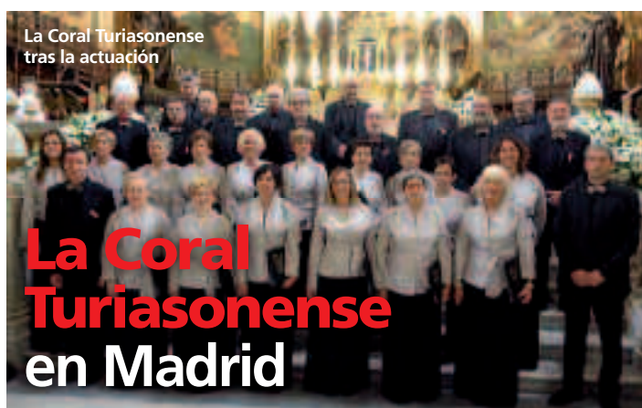
La Coral Turiasonense tras la actuación