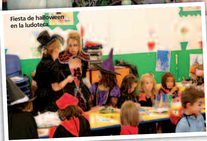
Fiesta de halloween en la ludoteca.

Pero no fueron los únicos, ya que una semana antes la ludoteca municipal celebró su particular fiesta de halloween con merendola, disfraces y juegos.