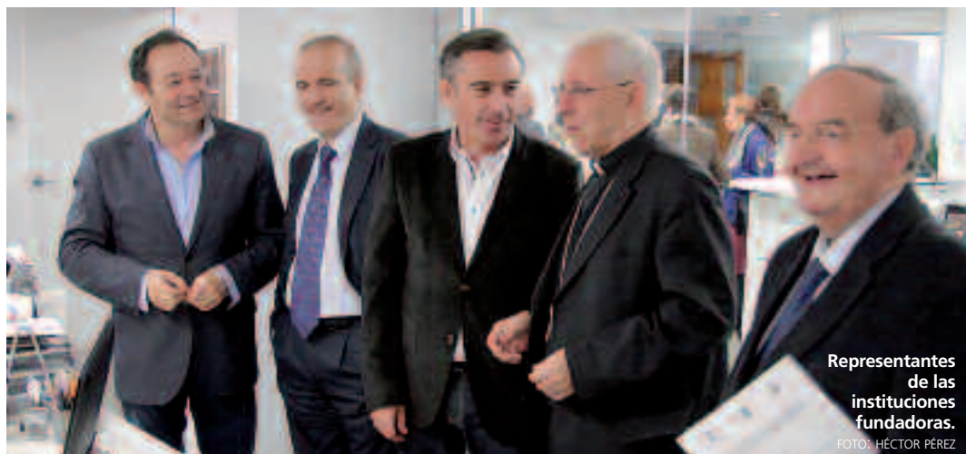
Representantes de las instituciones fundadoras.