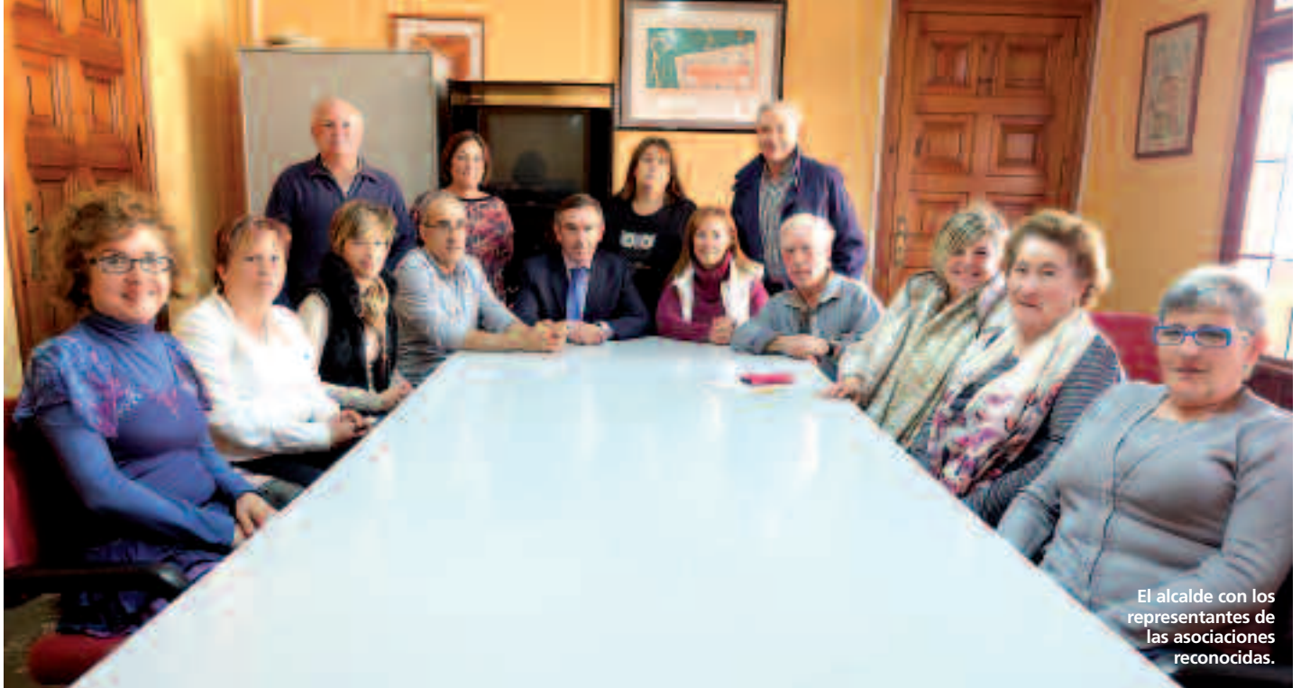
El alcalde con los representantes de las asociaciones reconocidas.