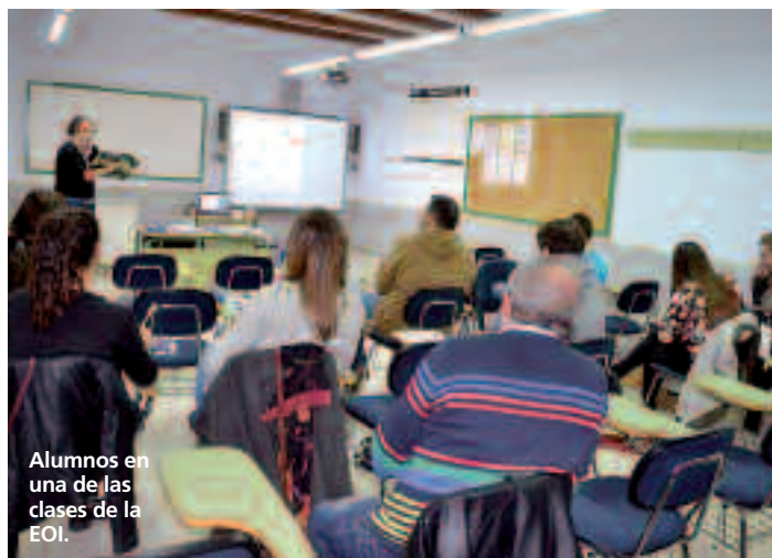
Alumnos en una de las clases de la EOI.

Los alumnos matriculados por enseñanza presencial reciben cuatro horas y media semanales de clase. Estas se imparten en hora-