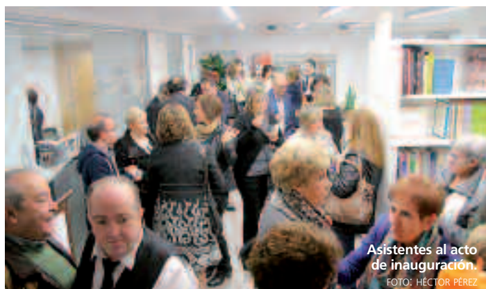
Asistentes al acto de inauguración.

El presidente de la Fundación señaló que esta sede no es solo un lu-