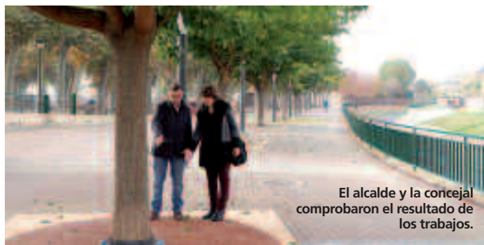
El alcalde y la concejal comprobaron el resultado de los trabajos.