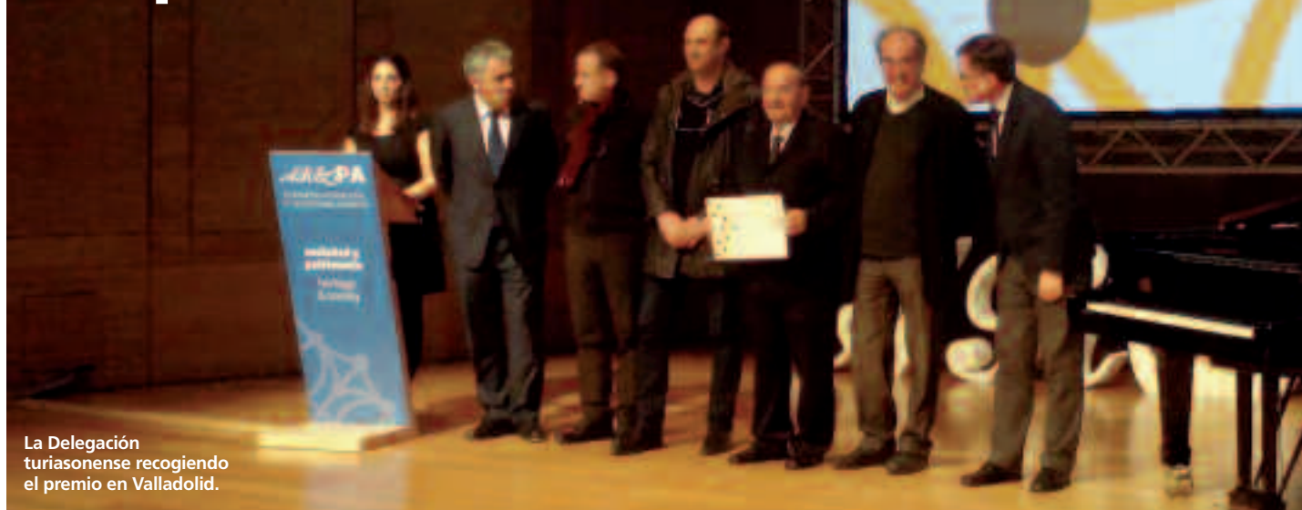
La Delegación turiasonense recogiendo el premio en Valladolid.