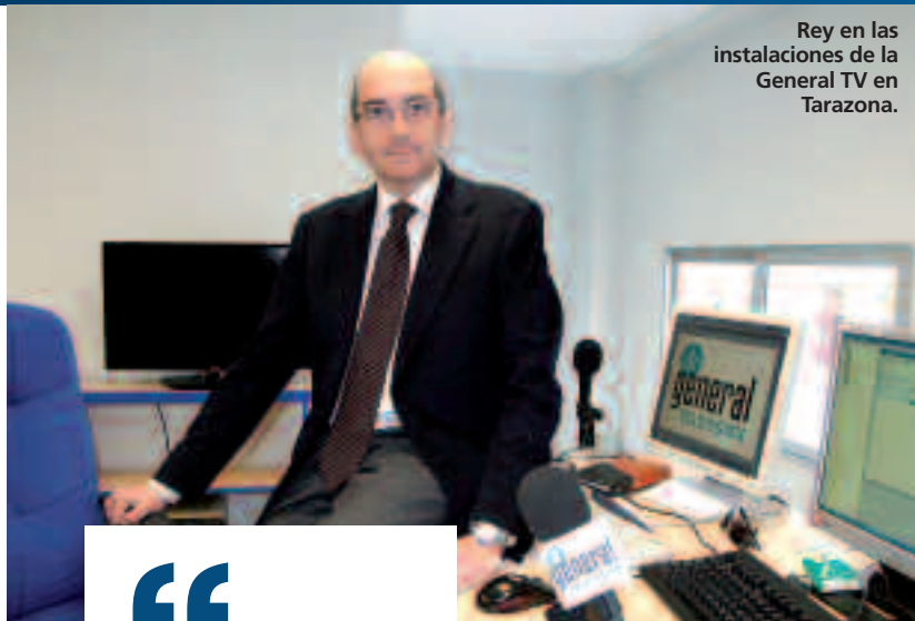
Rey en las instalaciones de la General TV en Tarazona.