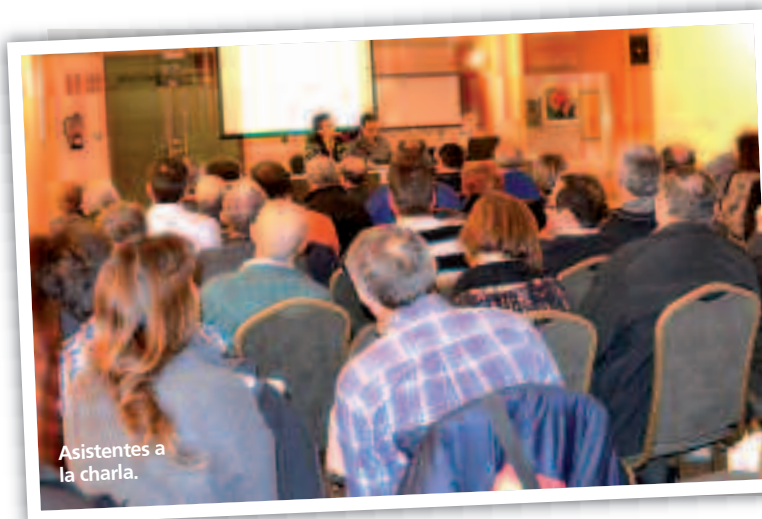
Asistentes a la charla.

La ordenanza se encuentra ahora en periodo de exposición pública para alegaciones hasta el 23 de diciembre.