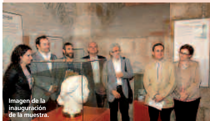
Imagen de la inauguración de la muestra.

U n total de 2.924 personas han visitado la exposición "El descubrimiento de Turiaso por Augusto" durante los casi seis meses que ha estado abierta en los bajos del Palacio Episcopal. La muestra, organizada por el Ayuntamiento de Tarazona, el Centro de Estudios Turiasonenses y el Museo de Zaragoza, se enmarca dentro de la decena de actos que se han organizado en la ciudad para conmemorar el bimilenario del fallecimiento del emperador Augusto. Además de Tarazona, la efeméride se ha celebrado en Zaragoza, Huesca, Calatayud y Veilla de Ebro.