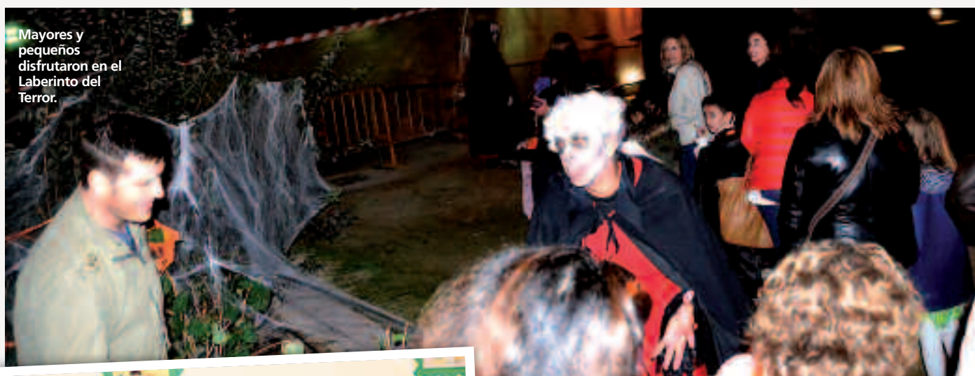
Mayores y pequeños disfrutaron en el Laberinto del Terror.

U nos 300 moteros venidos de todos los rincones de España se dieron cita el primer fin de semana de noviembre en “La Cipotegato”, organizada por el MotoClub Las Ratas del Queiles con la colaboración del Ayuntamiento y la Diputación Provincial de Zaragoza. Hubo juegos, carreras, una ruta por las vías de la Comarca y un desfile nocturno.