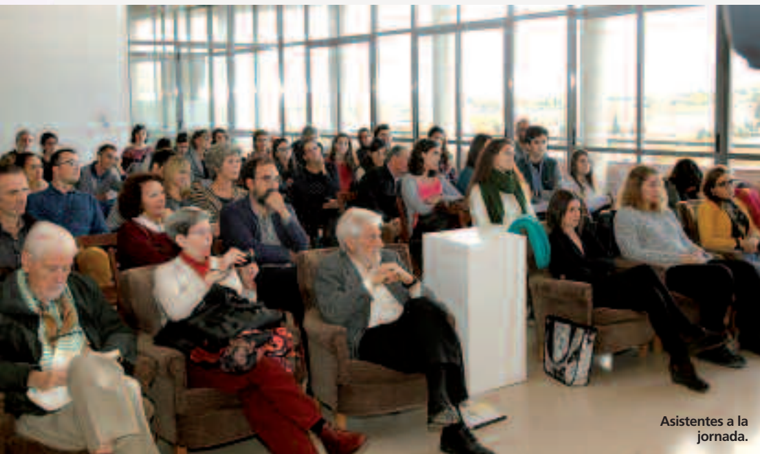
Asistentes a la jornada.