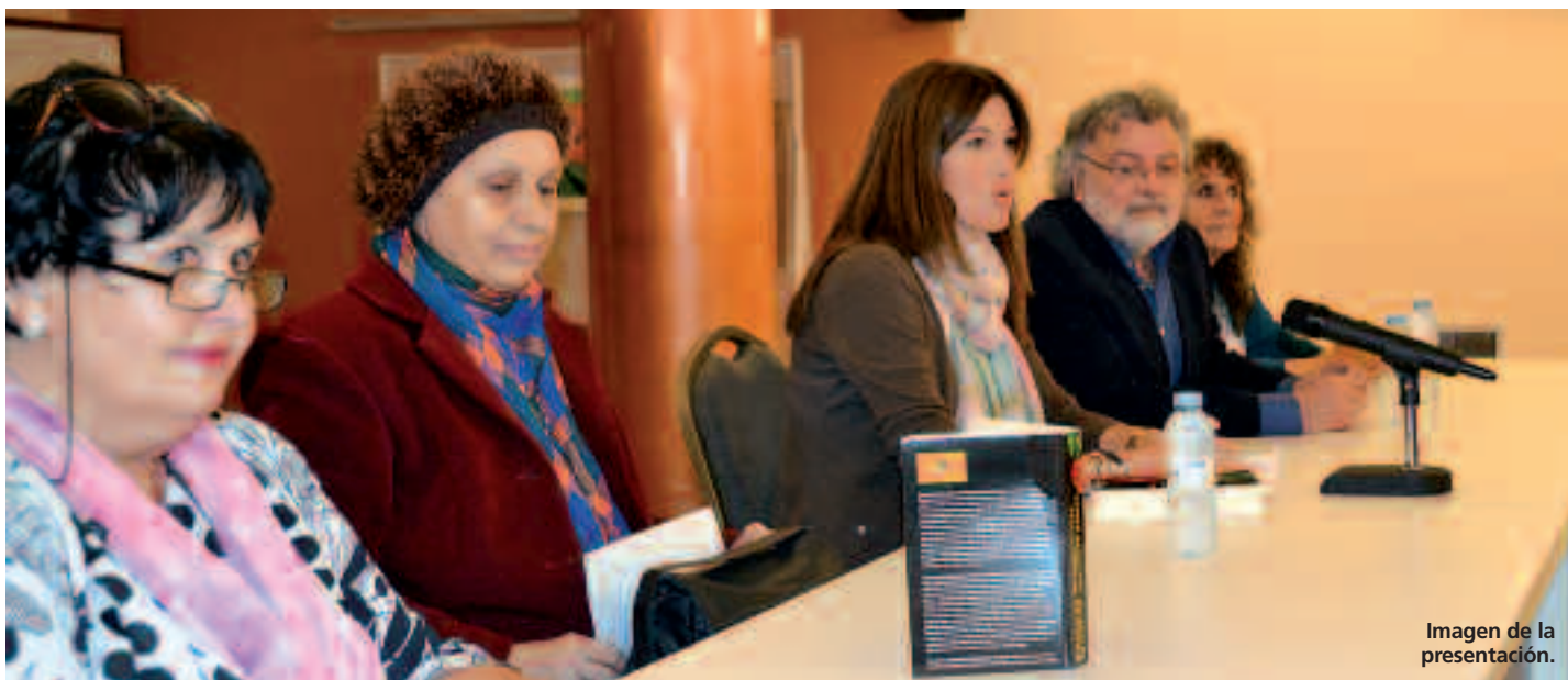
Imagen de la presentación.