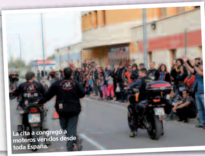
La cita congregó a moteros venidos desde toda España.