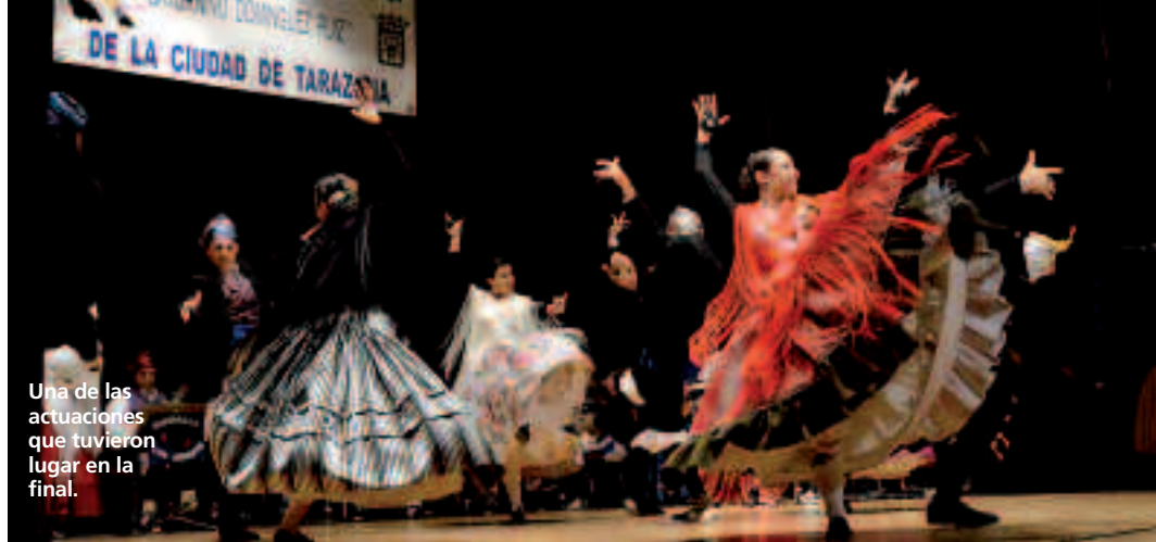
Una de las actuaciones que tuvieron lugar en la final.