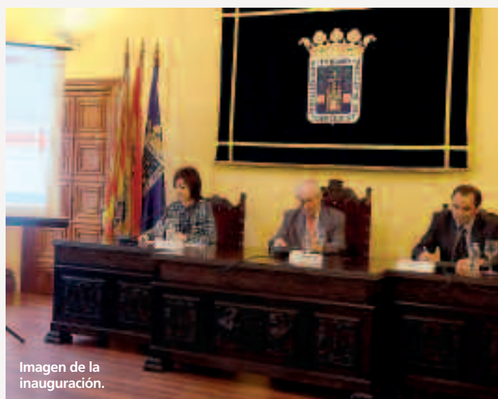
Imagen de la inauguración.

Además de presidir a través de CECAS la formación impartida en materia financiera y aseguradora en todo el territorio nacional, entre sus nuevas tareas destaca el control de la relación entre mediadores colegiados y aseguradoras, el control y vigilancia de las malas prácticas de aseguradores, banca-seguros y otros canales, así como la vigilancia deontológica de la profesión mediadora, el fraude en el sector seguros, y la defensa de los intereses en materia aseguradora de los consumidores en España.