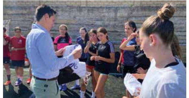
El campus de fútbol femenino fue el primero en celebrarse.