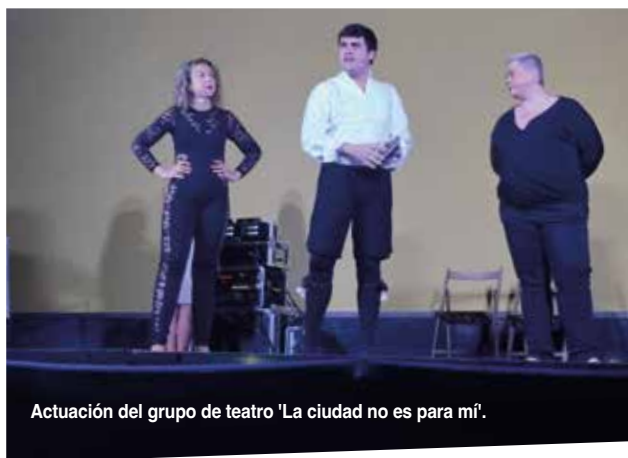
Actuación del grupo de teatro 'La ciudad no es para mí'.

La Casa del Traductor, en colaboración con el Ayuntamiento turiasonense, organizó un homenaje a Baltasar Gracián, escritor del Siglo de Oro que falleció en Tarazona el 6 de diciembre de 1658. El acto, con entrada gratuita, se desarrolló en el patio del palacio de Eguarás el sábado 5 de agosto.