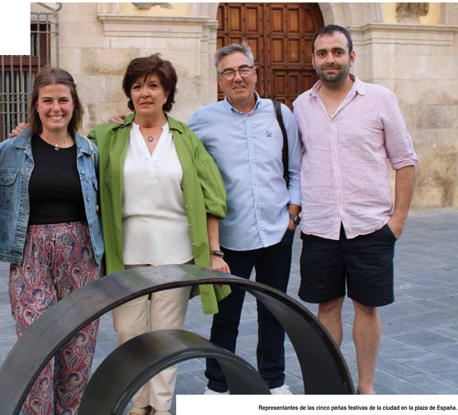
Representantes de las cinco peñas festivas de la ciudad en la plaza de España.

fiestas. El baile del clavel es un clásico de la Desbarajuste, pero esta peña también destaca que "su charanga les ameniza todos los actos, como dianas por la mañana, vermú y actos taurinos".