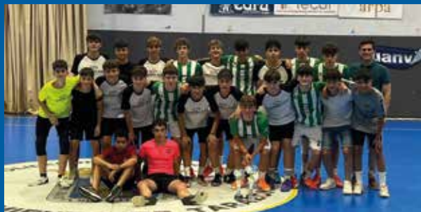
Finalistas en categoría cadete del torneo.