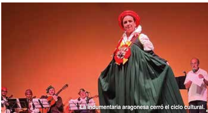
La indumentaria aragonesa cerró el ciclo cultural.