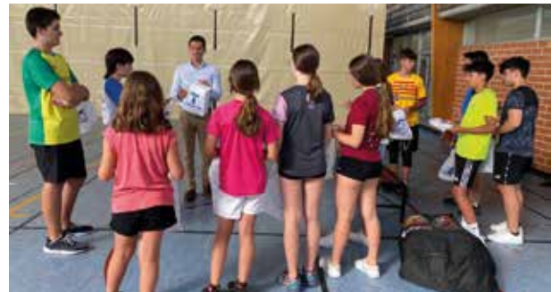
Entrega de un recuerdo en el campus de voleibol.