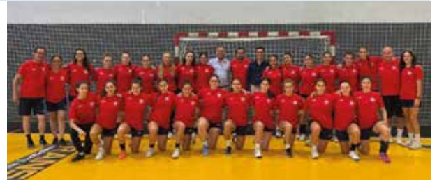
26 jugadoras de balonmano se dieron cita en la concentración.

Cerró la intensa programación deportiva el campus de voleibol del 7 al 18 de agosto. Jugadores y jugadoras se iniciaron en este deporte gracias a esta cita organizada por la Federación Aragonesa de Voleibol en colaboración con el Ayuntamiento. El objetivo era afianzar este deporte en la ciudad y los participantes también recibieron un recuerdo por parte del concejal de Deportes.