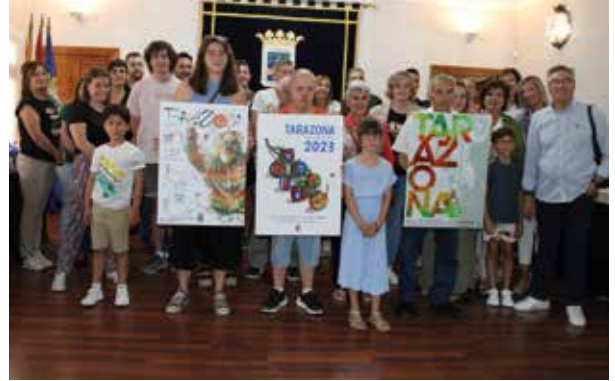
El jurado posa con los tres carteles finalistas.

El segundo premio, al que le corresponden 200 euros y diploma, fue para