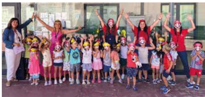
Fiesta por el final del primer turno.

Hubo 338 niños en julio y 215 en agosto, todos ellos desde 1º de Educación Infantil hasta 6º de Educación Primaria, aunque se pueden apuntar hasta 2º de la ESO. "El primer turno es el más numeroso pero cada vez se van