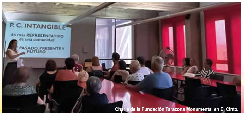
Charla de la Fundación Tarazona Monumental en El Cinto.