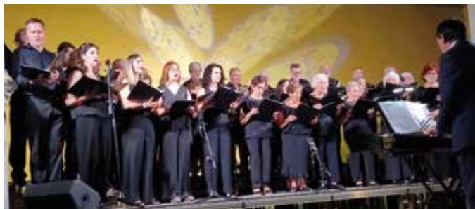
La Coral Turiasonense hizo un repaso por la historia de la música.

Cada provincia también estuvo representada con piezas de canto y baile características de la zona, y la Danza de Tarazona se alzó como homenaje a la ciudad en el marco del folclore aragonés más contemporáneo.