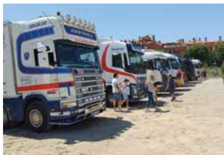
Camiones engalanados por la festividad. (ANDRÉS VICENTE)

La celebración tuvo lugar el sábado 8 de julio, dos días antes de la fecha en la que recuerda el santoral a San Cristóbal para así poder contar