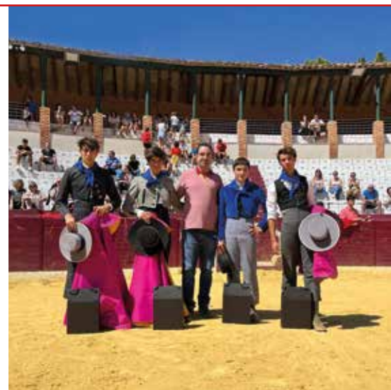
Tiente campera celebrada el 6 de agosto.

Para ir abriendo boca, los aficionados pudieron disfrutar el 6 de agosto con la tradicional tiente campera organizada por la peña taurina Moncayo. Tras el re-