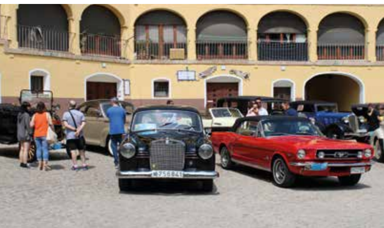
Los coches antiguos de la escudería Laurel de Baco se lucen en Tarazona.

Una treintena de vehículos anteriores a 1940 estacionaron en la plaza de Toros Vieja para poder ser admirados