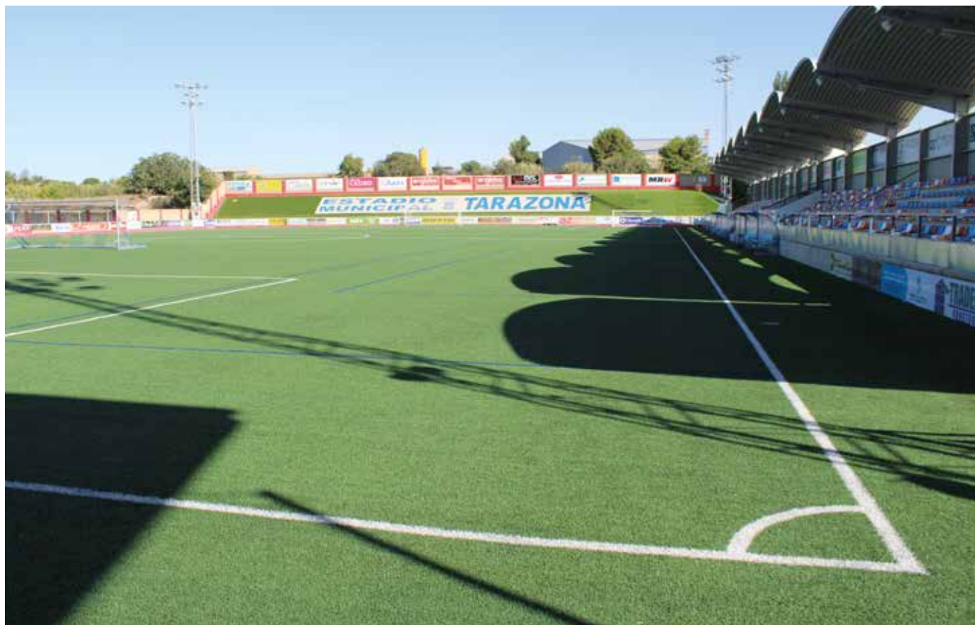
Esta inversión renovará el aspecto del Municipal.

Con este presupuesto se acondicionará el campo de fútbol para disputar partidos de 1ª RFEF y se iniciará el proyecto de la pista de atletismo