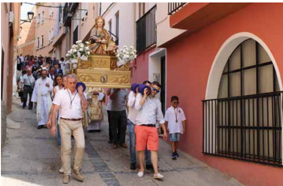
Procesión con la Virgen de La Magdalena por las calles del barrio.