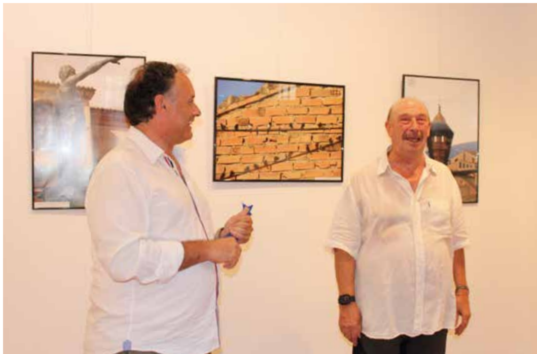
El alcalde inauguró la muestra del turiasonense.

En la muestra se encuentran numerosos retratos, que adquieren un protagonismo especial. "Me gusta mucho captar la mirada y el gesto de la gente cuando no está posando, sino cuando está distraída, mirando otra cosa porque me parece que queda más natural", opinó el fotógrafo.