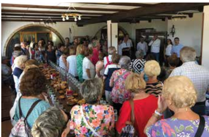
Uno de los momentos compartidos de esta jornada de convivencia.

Los turiasonenses participaron activamente en el Día de la Comarca 2023 que se celebró en la localidad de Santa Cruz de Moncayo el pasado 29 de julio.