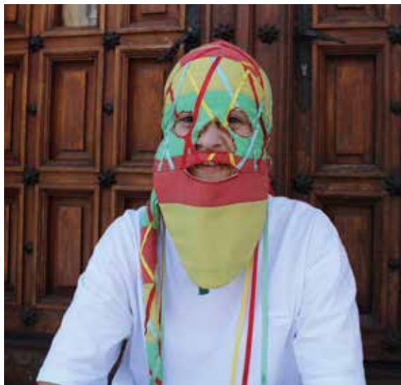
Delante de la puerta del Ayuntamiento, donde comenzará su gran día.

He hecho deporte toda mi vida, en el club de rugby Seminario Tarazona y mis compañeros estarán haciendo el pasillo este año. Con la pandemia dejé de entrenar, pero este año me he vuelto a poner en forma.