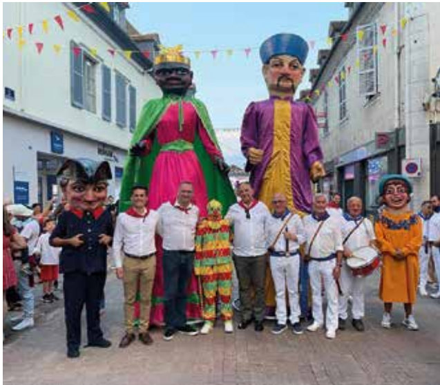
Delegación turiasonense en Orthez.