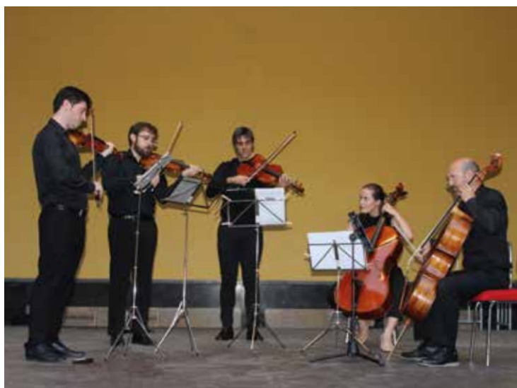
El quinteto 'Ensemble Eguarás' inauguró el festival.

El último fin de semana de julio se celebró la segunda edición del Festival de Música de Cámara 'Turiaso Classics', una cita organizada desde el departamento de Cultura del Ayuntamiento que nació con el objetivo de acercar este tipo de música a todos los turiasonenses en un escenario mágico como es el patio del palacio de Eguarás.