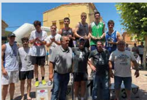
Entrega de trofeos del torneo de baloncesto.

La localidad de Litago acogió el pasado 8 de julio la celebración del Día del Deporte 2023, una jornada de convivencia organizada por la Comarca de Tarazona y el Moncayo en torno a la práctica deportiva para promover un estilo de vida saludable a la vez que se da a conocer el municipio anfitrión, que rota cada año, y la oferta deportiva existente en la comarca.