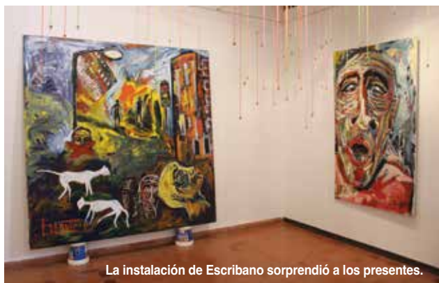
La instalación de Escribano sorprendió a los presentes.

Hubo que retrasar la inauguración "por motivos técnicos", pero cuando finalmente se abrió al público el 15 de julio lo hizo con muchos asistentes al acto de presentación de esta instalación del artista.