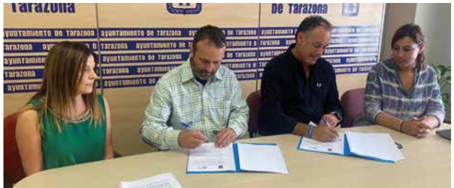
Sellando el acuerdo entre Ayuntamiento e instituto.

Desde sus inicios hace una década, el IES Tubalcaín ha enviado a un total de 114 alumnos a 9 países diferentes: Francia, Irlanda, Polonia, Irlanda del Norte, Alemania, Eslovenia, Italia, Portugal y Macedonia del Norte. Estas movilizaciones han enriquecido no solo la formación y experiencia de los es-