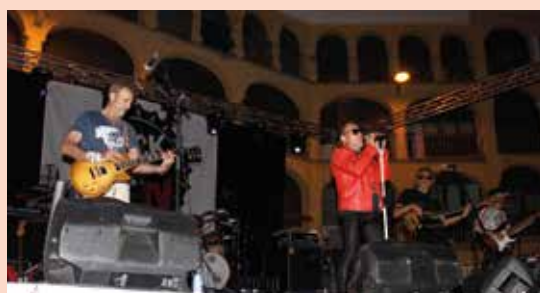
Concierto en la plaza de Toros Vieja.