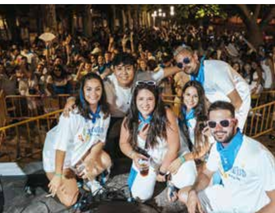
Una de las imágenes que dejó la edición de 2022.