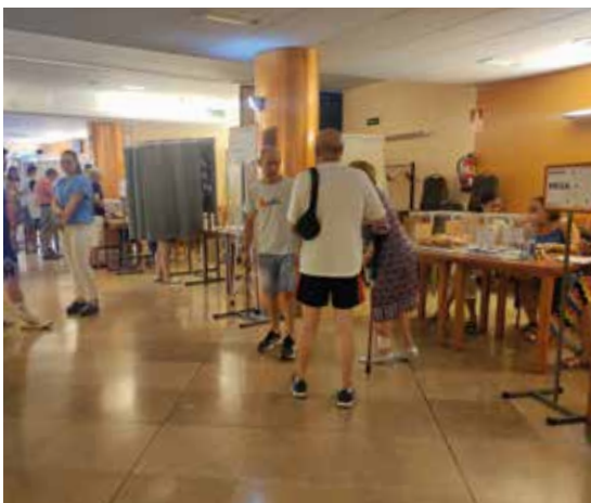
El Centro de Mayores se habilitó como colegio electoral.

El pasado 23 de julio las elecciones generales al Congreso de los Diputados y al Senado transcurrieron con normalidad en Tarazona, en una calurosa jornada de domingo.