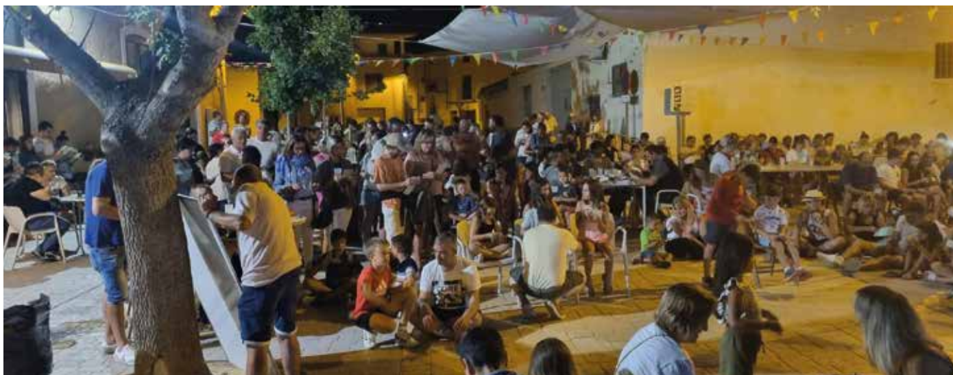
Jugando al bingo en el barrio de Tórtoles.