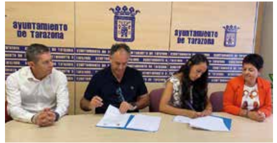
Comerciantes y Ayuntamiento colaboran desde hace más de tres décadas.

Participan establecimientos de distintos sectores: moda y complementos para hombre, mujer y niño, belleza, alimentación, hostelería, y todo tipo de profesionales. "Cuando pensamos en fiestas patronales lo primero que nos viene a la cabeza es la ropa blanca y los complementos propios de fiestas, pero también tenemos que cubrir otro tipo de necesidades relativos a otros sectores como son alimentación, hostelería, o belleza", explican desde ACT.