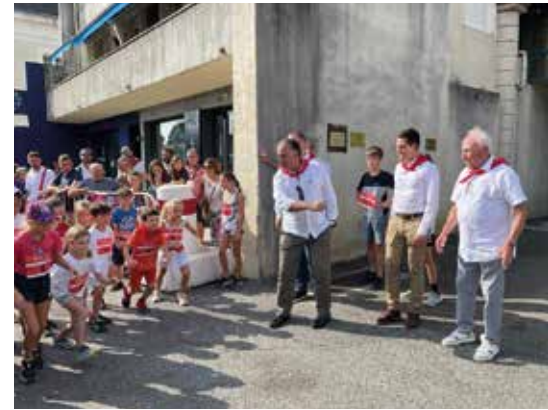
Dando la salida en una carrera.

Durante su estancia en Orthez, la delegación turiasonense asistió también a una carrera de atletismo, un torneo internacional de pelota entre España y Francia, una carrera ciclista, un concierto en la plaza de toros, y un festejo taurino popular