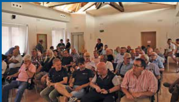
Asistentes a la asamblea del club.

El primer paso es que un abogado especializado en derecho deportivo inicie las tramitaciones. “Después, el Centro Superior de Deporte (CSD) auditando las cuentas de los dos últimos años, fijará el valor económico del club y a partir de ahí sacaremos unas acciones que en primera ronda podrán comprar los socios, en segunda ronda sólo los socios y