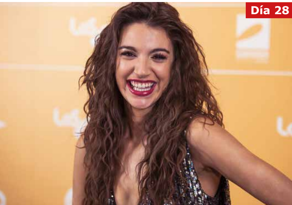
ANA GUERRA - Ana Guerra ofrecerá el primer concierto el día 28.

Para culminar las festividades en la noche del 1 de septiembre, 'Los40 in sessions tour' cerrará como broche de oro, con los dj's JM Duro, Arturo Grao y Abel 'the kid'. Será también en el escenario del aparcamiento junto a la catedral, pero a partir de las 00:15 horas, tras la colección de fuegos artificiales y quema del sapo.