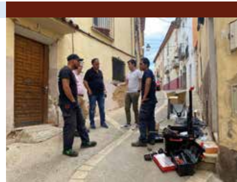
Visitando los trabajos del cambio de luces.

vo alumbrado, se busca no solo mejorar los niveles de iluminación en la zona, sino también fomentar el ahorro energético y reducir la contaminación lumínica. Estos cambios contribuirán positivamente al medio ambiente y a la calidad de vida de los habitantes de Tarazona.