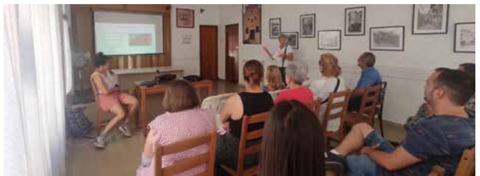
Charla en La Almehora a cargo del centro de salud.