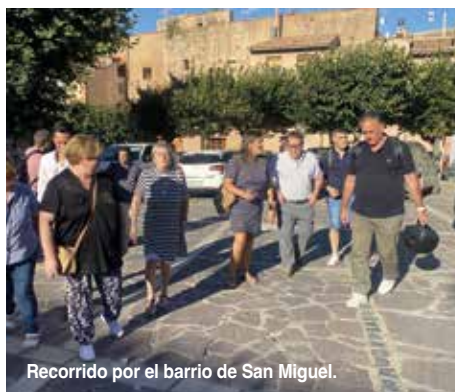
Recorrido por el barrio de San Miguel.

El equipo de gobierno emprende así una política de permanente contacto con