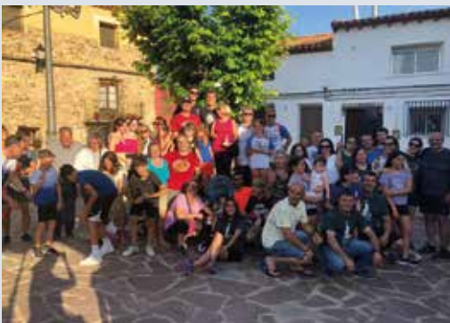
Senderistas que realizaron el recorrido por Litago.