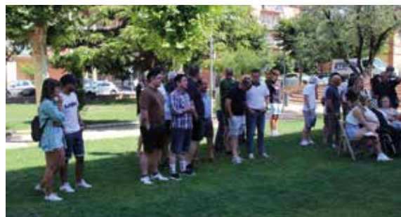
Se reunieron en el parque de La Estación.

con una mayor participación al coincidir con un día laborable.