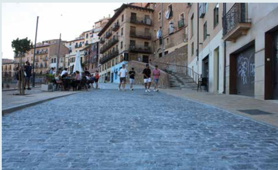
Los trabajos en Fueros de Aragón finalizaron el 12 de agosto.

para verificar la finalización de las obras de renovación de la red de abastecimiento, fase I. Estas intervenciones se llevaron a cabo en la Avenida de Navarra y la travesía de la Carretera Nacional N-121, abarcando desde el número 68 (plaza de Toros) hasta la intersección con la calle Ateca (barrio de Tórtolas). El costo total de esta primera fase ascendió a 193.067,26 euros.