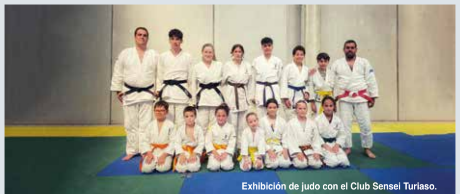
Exhibición de judo con el Club Sensei Turiaso.

El objetivo de esta jornada es favorecer la convivencia de los dieciséis pueblos de la Comarca, pero es fundamental para su realización la colaboración de todas las asociaciones deportivas y los voluntarios que ayudan cada año en la organización.