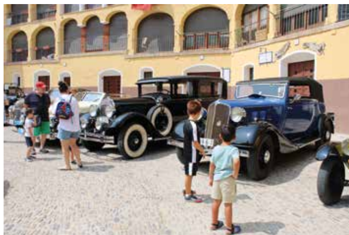
Una treintena de vehículos anteriores a 1940 estacionaron en la plaza de Toros Vieja para poder ser admirados.

Impresionante concentración de coches antiguos en la plaza de Toros Vieja de Tarazona. La escudería Laurel de Baco de Vehículos Antiguos de Soria celebraba del 20 al 22 de julio su XXXIV concentración y quiso hacer parada en la ciudad turiasonenense durante su recorrido.