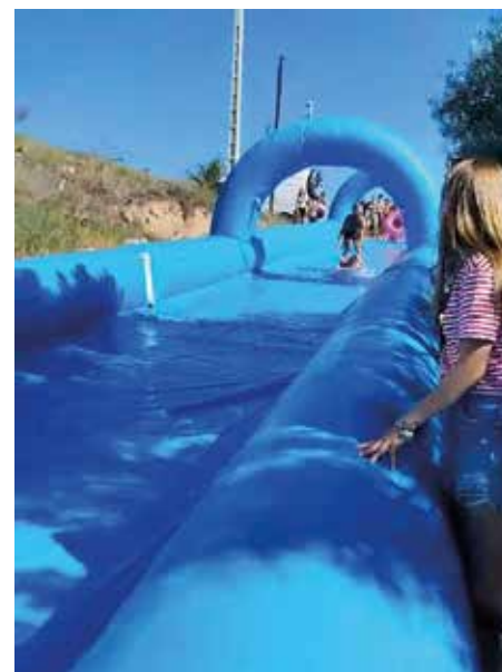
Tobogán acuático de Cunchillos.

ciación de vecinos durante muchos años. Gracias a él "se hace hoy en día todo lo que hacemos".