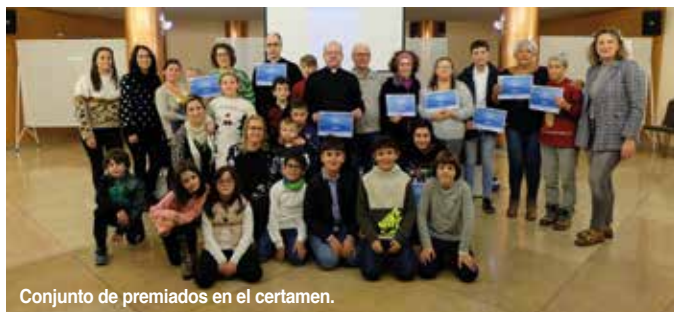
Conjunto de premiados en el certamen.