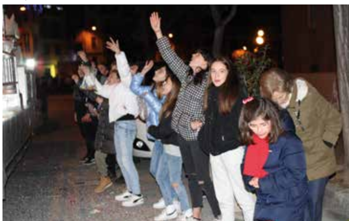
El público saludó a los Reyes a su paso..