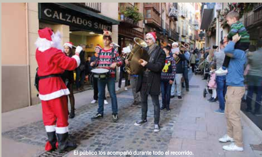
El público los acompañó durante todo el recorrido.

Por otro lado, la asociación ofreció un exitoso concierto el día 30 en el teatro Bellas Artes, para el que se agotaron las entradas anticipadas en la Oficina Municipal de Cultura. La entrada era gratuita y el numeroso público disfrutó con el concierto en el que se interpretó la música de Ennio Morricone y John Williams, dos maestros de las bandas sonoras.