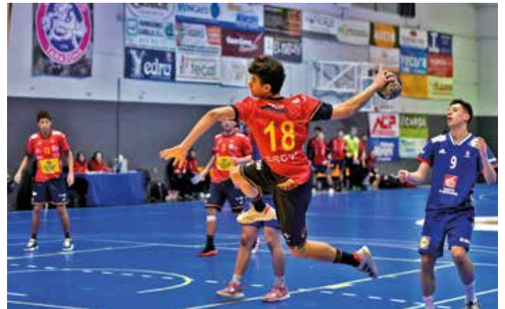
Partido de España contra Francia en la jornada 3.

vayan con la satisfacción de la victoria en el torneo y sobre todo por los dos últimos partidos de altísimo nivel".