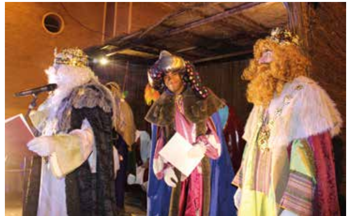
Los Reyes Magos se dirigieron al público desde el portal.