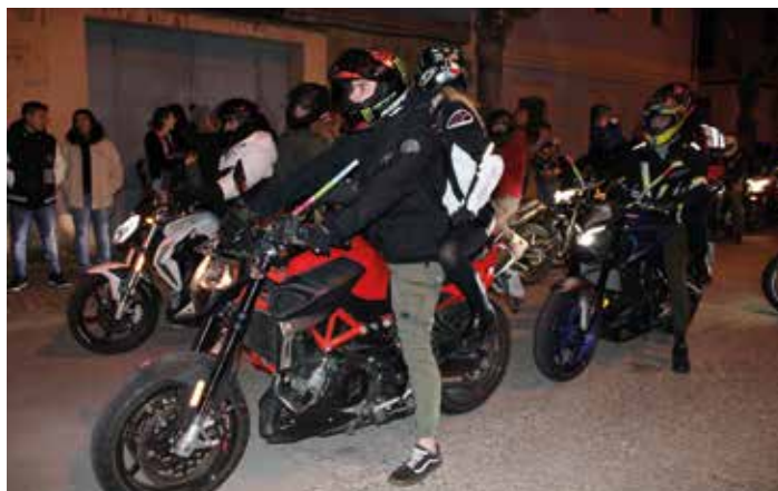
Moteros de 'Las Ratas del Queiles' salieron en el desfile.