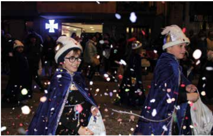
Se lanzaron 100 kilos de confetis para la ocasión.