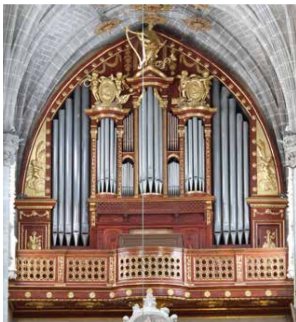
El mueble del órgano de la catedral ha recuperado su color y brillo. (FTM)

Por otra parte, la Fundación ha incorporado señalización vial en diferentes puntos de la carretera nacional que pasa por el centro de la ciudad para mejorar la accesibilidad a sitios de interés que se están potenciando turísticamente desde hace tiempo, como la mezquita de Tórtoles, el Barrio de San Miguel y las Murallas.