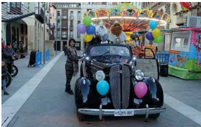
Los Reyes saliendo hacia Tórtoles y Cunchillos.