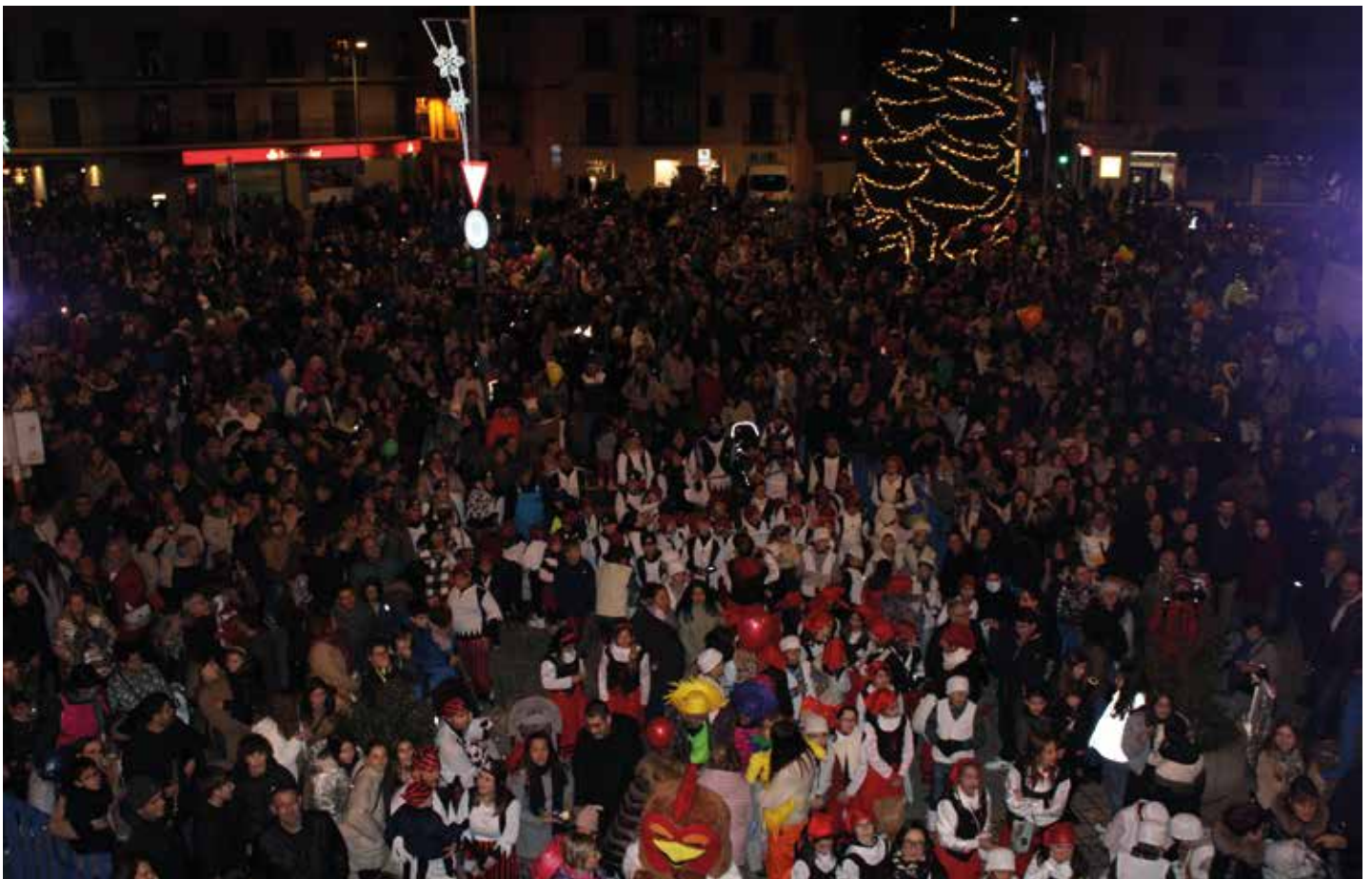
La multitud se congregó para escuchar a los Reyes.