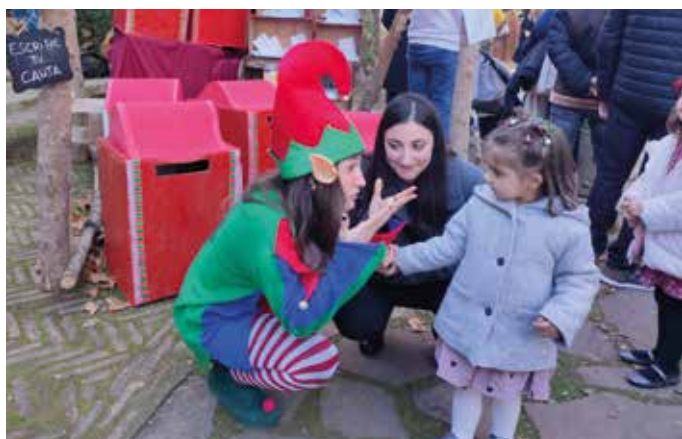
Los elfos recogieron las cartas de los niños.