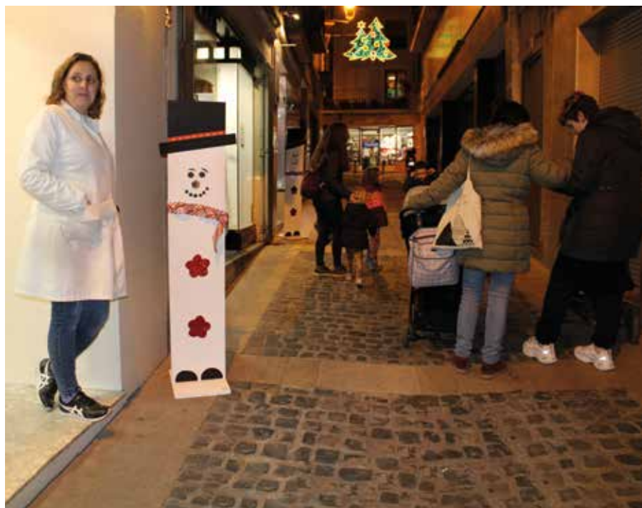
Muñecos de nieve en comercios de la calle Visconti.

Ahora en enero la campaña de rebajas de invierno es la protagonista en los comercios de ACT, que ofrecen a sus clientes sus productos con la calidad habitual y unos descuentos del 10%, el 20% o incluso llegando en algunos casos hasta el 50%.