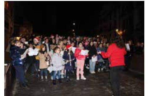
Niños cantores participantes en el taller del Conservatorio.

Ya en enero, desde el Conservatorio informan que habrá un curso de cajón flamenco los días 9 y 10, el martes 17 tendrá lugar la audición de música de cámara y el 18, la de violín. El día 20