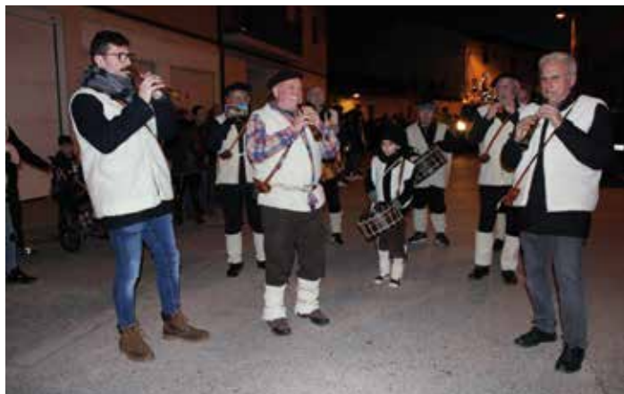
La música de los Gaiteros de Tarazona sonó en la cabalgata.