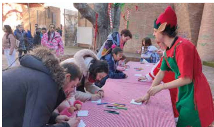
Niños y mayores escribieron sus deseos para 2023.