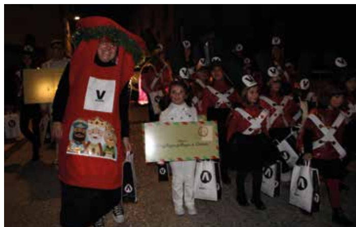
El buzón y la carta que prepararon desde Óptica Vicente.