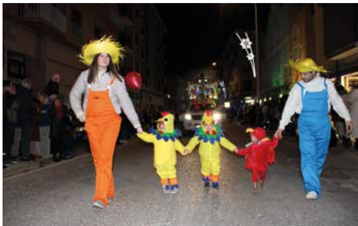
Granjeros del centro Canguro con sus pequeños animales.