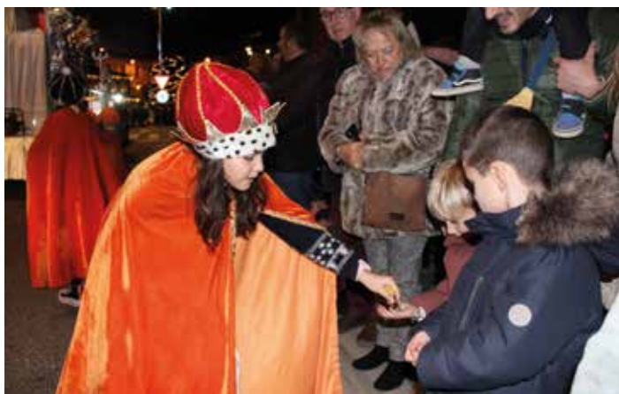
Se repartieron 500 kilos de caramelos en todo el recorrido.