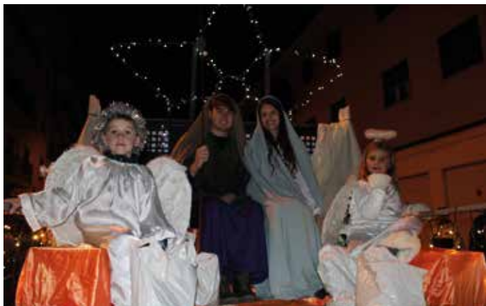
Los miembros del portal de Belén de camino a su destino.