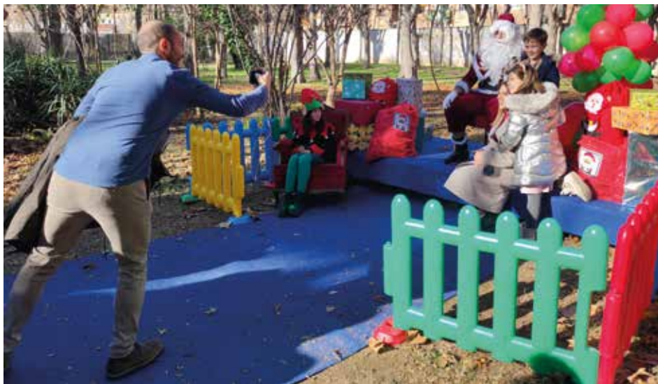
Las familias se hicieron la foto con Papa Noel de recuerdo.

La cita, con entrada gratuita, fue un gran éxito de asistencia, y una de las novedades de la programación cultural que preparó el Ayuntamiento para las fechas navideñas.