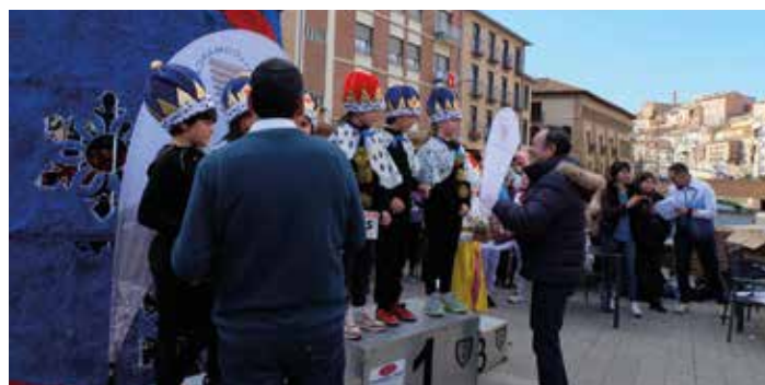
El alcalde y el presidente de la Comarca entregando un premio.

Este año, de nuevo se colaboró en la Operación Kilo de Cáritas y como novedad, Cruz Roja Juventud estuvo recogiendo juguetes "para que ningún niño se quede sin regalo estas navidades y podamos llegar donde no llegan los Reyes Magos".