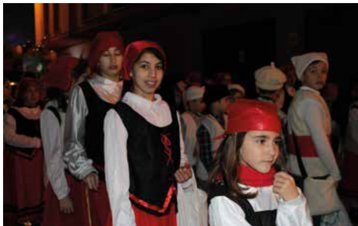
Los pastores acompañaron al niño Jesús.