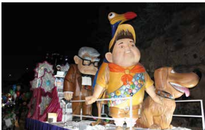
Los dj's se subieron a las carrozas para ambientar el momento.