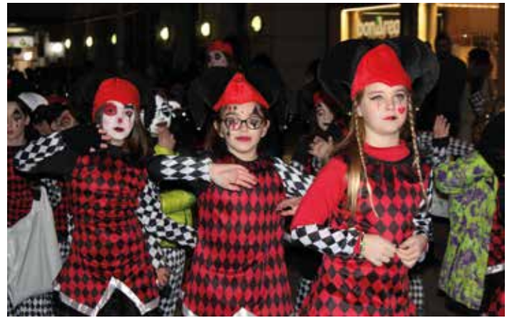
Los arlequines bailaron al ritmo de la música.