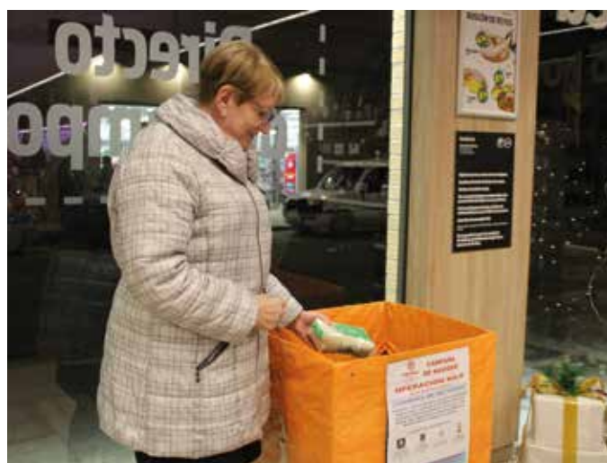
Recogida de alimentos en un céntrico supermercado.

Igualmente fue posible colaborar en diferentes eventos deportivos, como el partido de BM Tarazona contra el Eibar el día 10, el encuentro entre la SD Tarazona y el CD Arnedo el día 17, y la tradicional carrera de la San Silvestre para despedir el año en la mañana del 31 de diciembre.