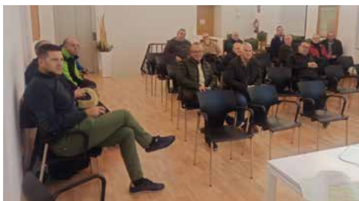
Asistentes a la charla en la Comunidad de Regantes.

E l Gobierno de Aragón y el Ayuntamiento de Tarazona colaboraron para ofrecer en la ciudad la charla informativa ¡Ayúdanos! El fuego no perdona, dentro de una campaña puesta en marcha para prevenir incendios forestales como el del pasado mes de agosto en Moncayo.