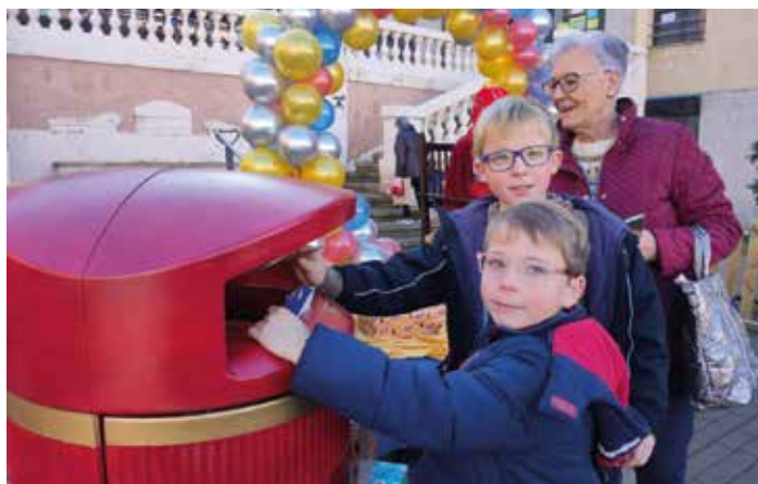
Los niños depositaron sus cartas en el buzón.