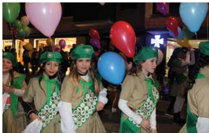
Un total de 600 globos se utilizaron en la decoración.