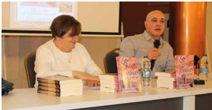
La presentación transcurrió en el Centro de Mayores.

Tras su obra 'Sin perdón', Chueca presenta una novela ambientada a finales de la II Guerra Mundial. Cuando el inminente final de la guerra está próximo, en un Instituto de Ciencias de Berlín, se comete un asesinato apoyado por la impunidad transferida de la guerra. Pero no es el único crimen que aparece en las páginas de 'El abrazo del diablo', el lector podrá ir descubriendo el lazo que une a los diferentes personajes a medida que avance en esta lectura que le traslada a una sórdida época.