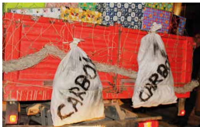
En el camión de los regalos no faltaba el carbón.