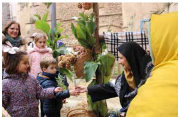
El taller de cestería ofreció obsequios a los ciudadanos.