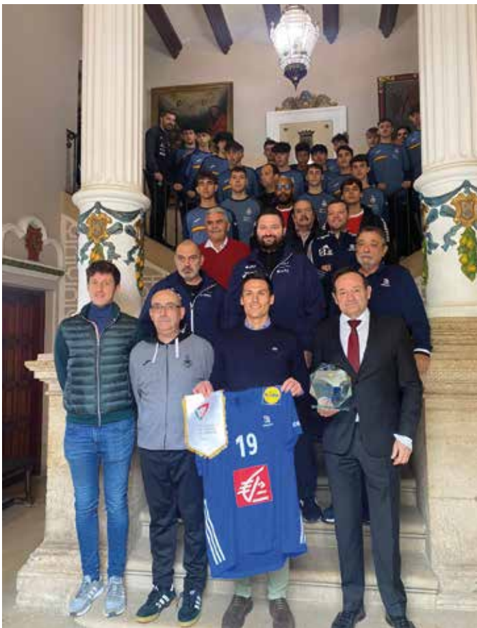
Recepción oficial a los equipos participantes.