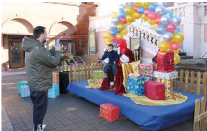
El paje real atendió a los pequeños en la plaza de San Francisco.