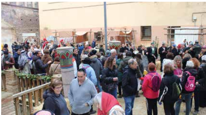
Cientos de personas quisieron visitar el Belén Viviente.