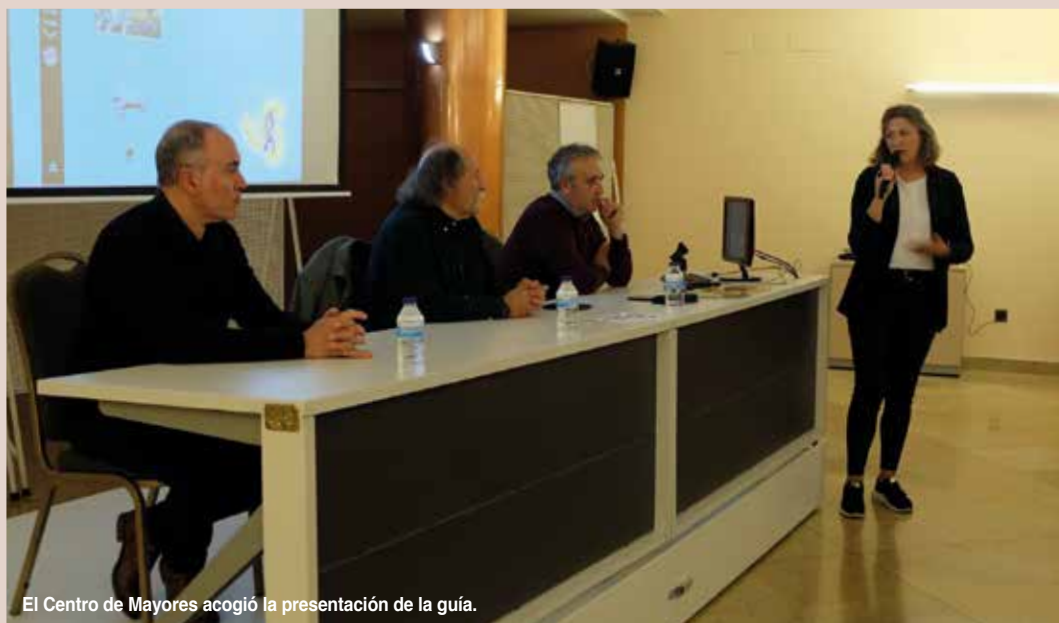
El Centro de Mayores acogió la presentación de la guía.

La asociación Amigos de la Celtiberia tuvo un papel fundamental en la gestación, elaboración y difusión