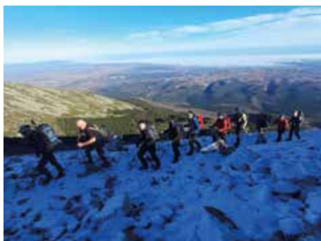
Ascenso hasta la cumbre de Moncayo.

se celebrará el concierto del Trío Bois, habrá una nueva audición, en este caso de flauta travesera el lunes 23 y por último, un curso de viola el 30 de enero.