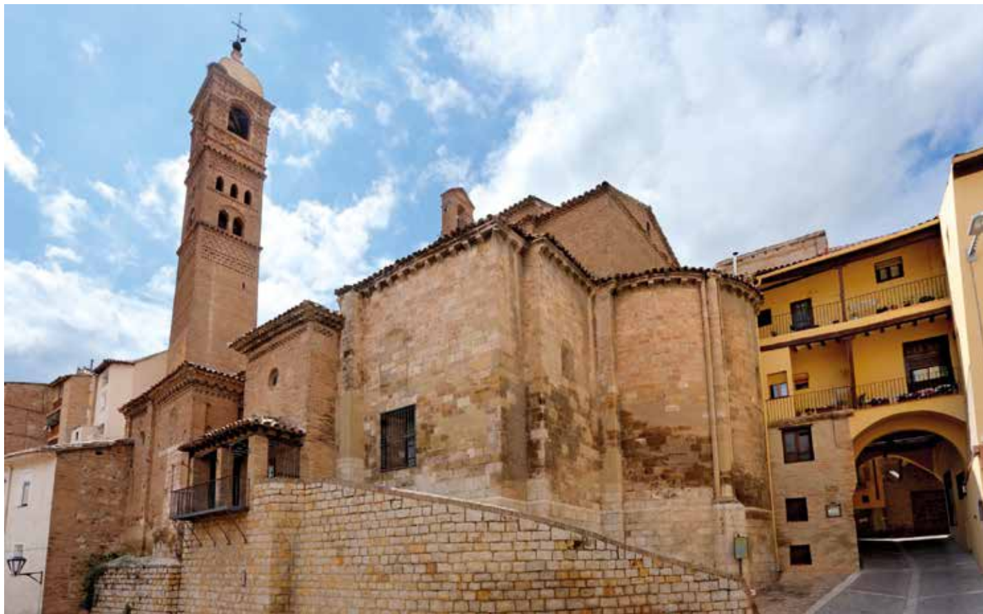
La torre de la Magdalena es un ejemplo del mudéjar en la ciudad.

El pleno aprobó por unanimidad la unión a esta red de municipios impulsada por la DPZ para preservar y difundir el arte mudéjar en la provincia