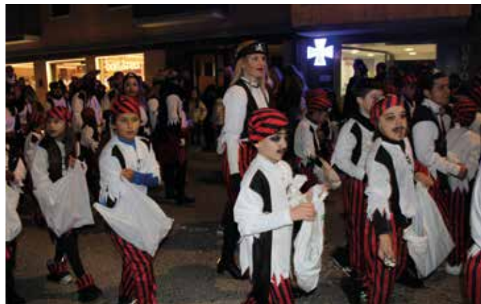
Los piratas acompañaron la carroza de Jack Sparrow.