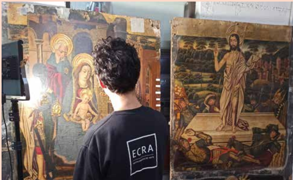
El retablo es de estilo gótico y renacentista. (DPZ)

Los trabajos de restauración están siendo realizados en Madrid por la empresa Ecra Servicios Integrales de Arte. La obra, con unas dimensiones aproximadas de 6,50 x 4,25 metros, estaba ubicada en el muro este de la capilla. Se compone de pinturas góticas sobre cinco tablas de madera policromada y varias esculturas realizadas en nogal, mientras que la mazonería es de madera de pino.