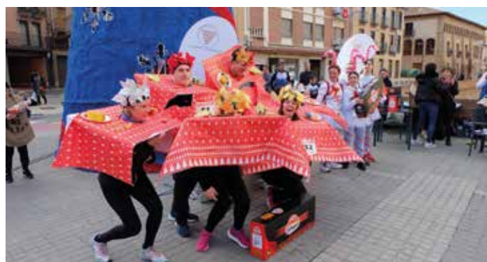
Estas mesas navideñas tuvieron premio.