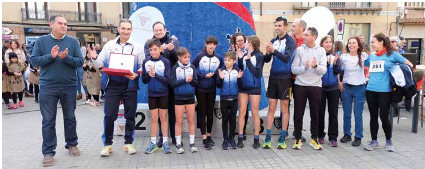
Reconocimiento al Club Atletismo Tarazona por la organización.

El Ayuntamiento turiasonense y la Comarca de Tarazona y el Moncayo volvieron a celebrar su San Silvestre, una carrera que el 31 de diciembre de 2022 celebró su XIII edición.