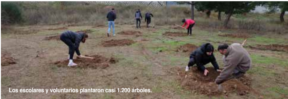
Los escolares y voluntarios plantaron casi 1.200 árboles.

“En DKV tenemos como objetivo plantar un millón de árboles antes de 2030, dentro de nuestro plan contra el cambio climático con el que queremos restaurar bosques y llenar de zonas verdes las ciudades de España para renaturalizarlas”, añadió la ambientóloga Pahissa.