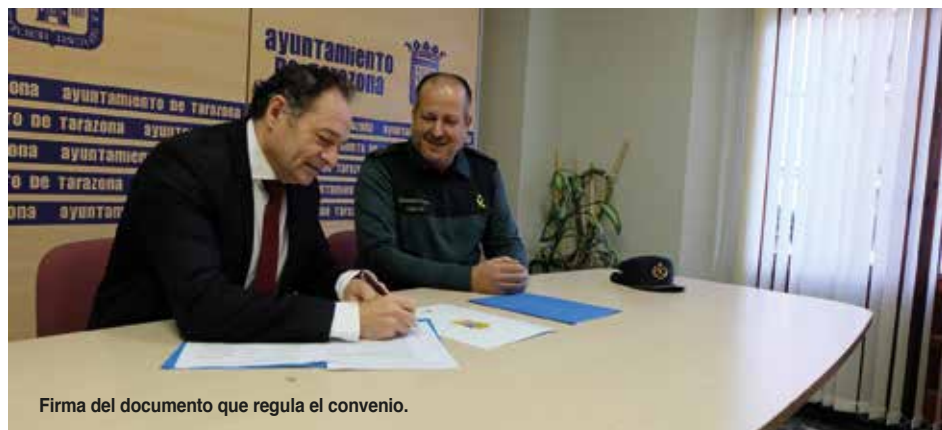
Firma del documento que regula el convenio.

El procedimiento operativo de coordinación garantiza el cumplimiento de las medidas judiciales de protección