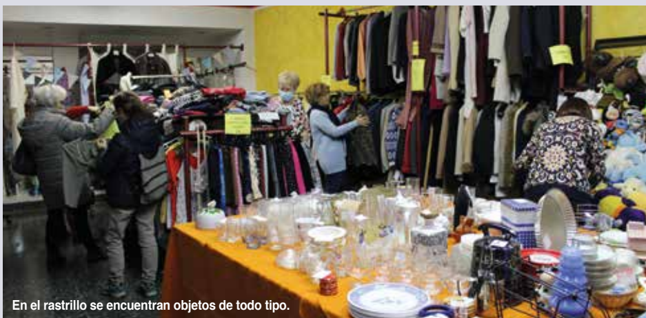
En el rastrillo se encuentran objetos de todo tipo.

El dinero recaudado en el rastrillo es la principal fuente de ingresos anual de APATA, junto con