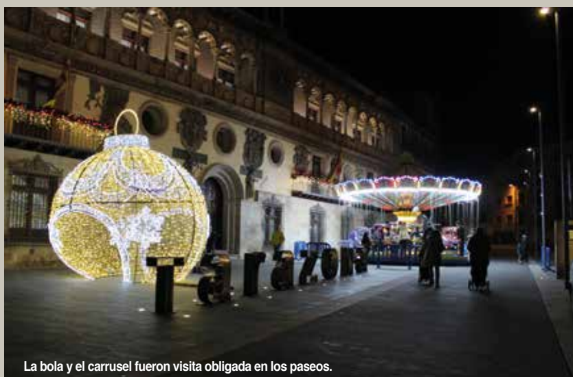
La bola y el carrusel fueron visita obligada en los paseos.

Asimismo, se dio el primer paso para ir iluminando otras zonas de la ciudad de peso también comercial, como el tramo de la avenida de la Paz, decorando el tronco de los árboles con malla led con 'flash'.