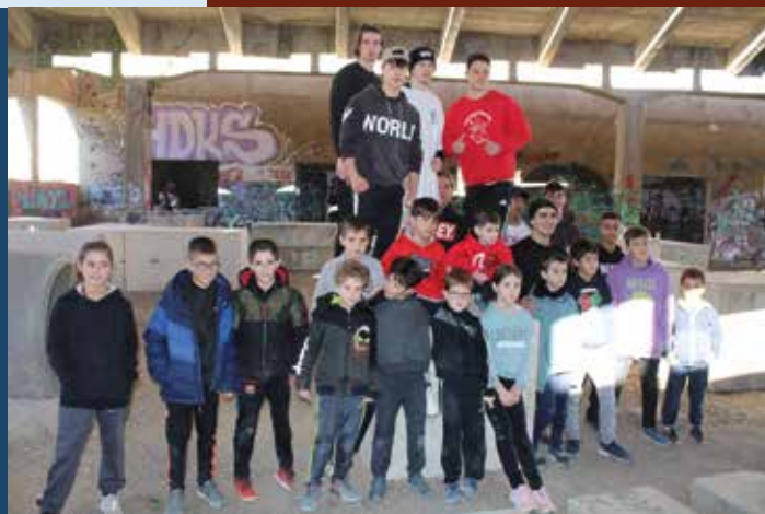
Final del taller con los niños participantes en el mismo.

En este espacio se han colocado varios bloques y tubos de hormigón con el fin de poder saltar de uno a otro y de hacer movimientos entre ellos. "Es verdad que igual para los más pequeños pueden ser un poco grandes, porque están puestos a la altura de alguien que ya sabe entrenar y a los que