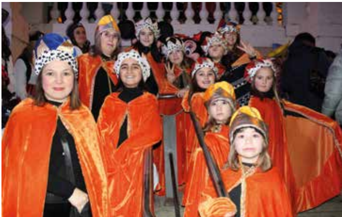
Un grupo de pajes reales a su llegada a San Francisco.