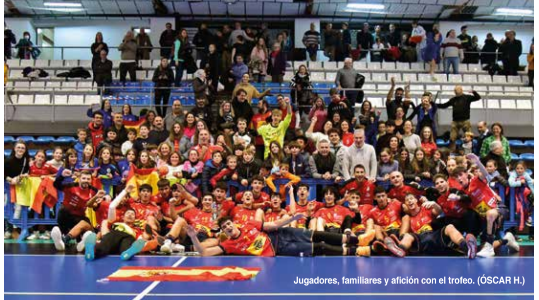
Jugadores, familiares y afición con el trofeo.