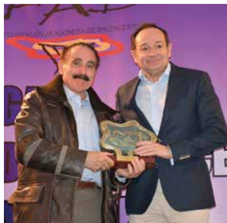
El alcalde recogió el galardón en la gala. (FAB)