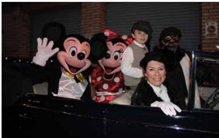
Mickey y Minnie a bordo de un descapotable antiguo.