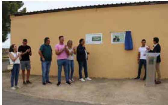
La placa con el nombre de Santos ya luce junto a la pista.

Los aficionados más pequeños pueden poner en práctica el uso de la bicicleta con seguridad, al ser un circuito sin tráfico que también se pretende utilizar para ofrecer clases de seguridad vial a los escolares. Tras la inauguración, jóvenes corredores del Club Ciclista Turiaso dieron unas vueltas al nuevo espacio.