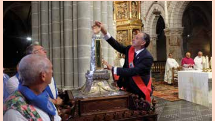
El alcalde colocó el anillo episcopal en la reliquia de San Atilano.