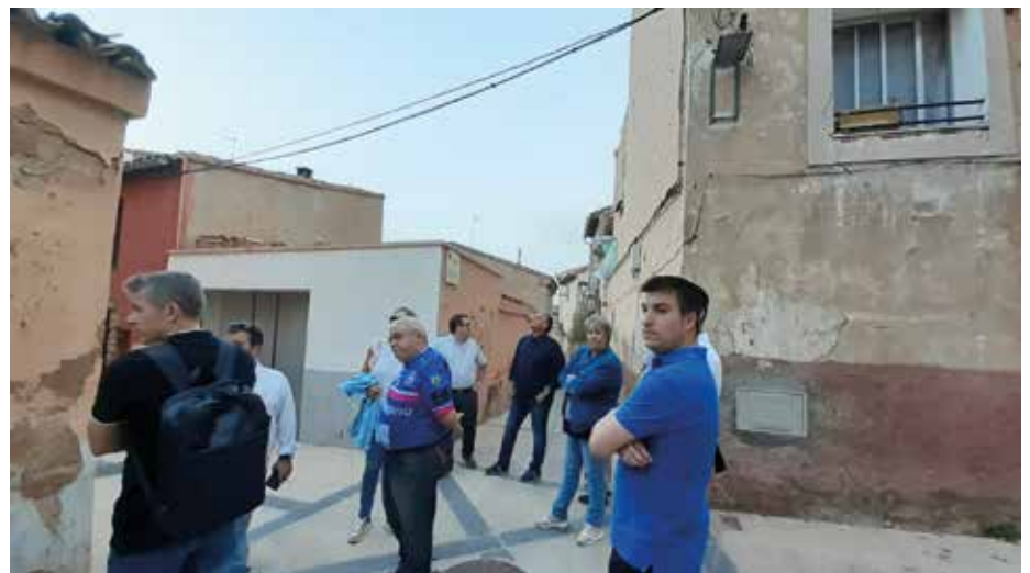
Una de las paradas que se hizo durante el recorrido por El Cinto.

cia con la finalidad de promover la recogida de excrementos de mascotas, ya que no todos los dueños de animales muestran civismo en este punto.