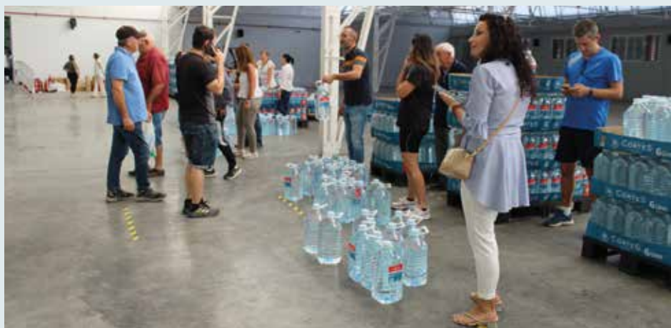
Reparto de agua en el recinto ferial turiasonense.