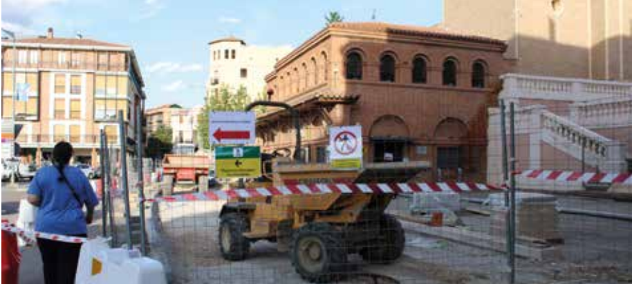
Se ha habilitado un paso para facilitar el tránsito de peatones.

T ras las fiestas patronales regresaron los trabajos de mejora a dos puntos importantes de la ciudad como son la plaza de San Francisco, en pleno centro del municipio, y la avenida de Navarra, vía de salida hacia Tudela.