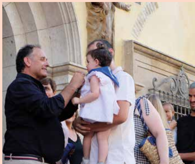
Los nacidos en 2022 recibieron su pañuelo de fiestas.