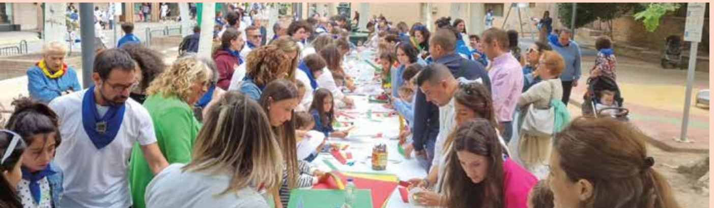
Más de trescientos niños participaron en los talleres sobre el Cipotegado.