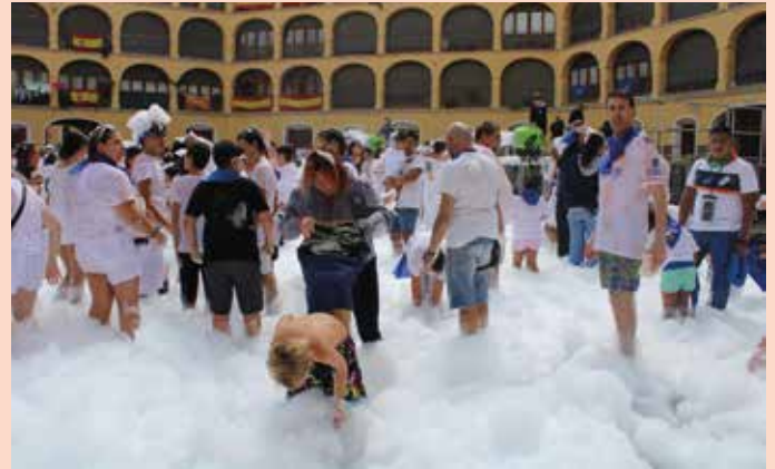
Pese a las frescas temperaturas, hubo valientes en el baño de espuma.