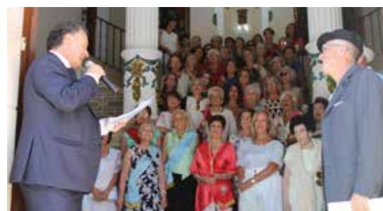
Homenaje a las reinas y damas de las fiestas.