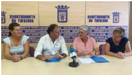
Las familias y el proyecto ‘Arropados’ se beneficiarán de la ayuda.

El Ayuntamiento tarazonense destinará 50.000 euros a Cáritas Diocesana de Tarazona para que esta entidad pueda seguir desarrollando dos proyectos sociales en la ciudad.