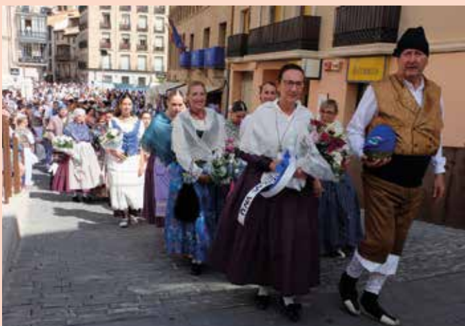
Flores y frutos en el desfile para honrar a la patrona, la Virgen del Río.