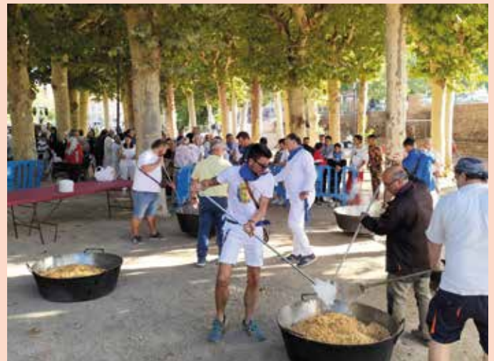
Como cada año la brigada municipal preparó unas ricas migas en Pradial.