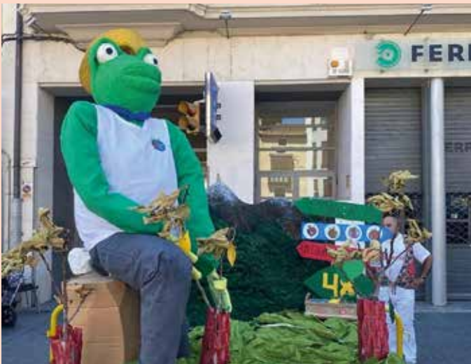
El Sapo desveló su caracterización de este año el último día de fiestas.