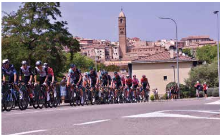
El pelotón a su paso por la N-122.

T arazona recibió a los corredores de La Vuelta Ciclista a España el pasado 7 de septiembre, en la etapa que unía Ólvega y Zaragoza. Los corredores pasaron por la travesía de la N-122, donde el público les recibió con vítores y aplausos para animarlos.