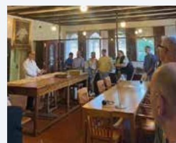
Documentos judíos en el archivo catedralicio.

Además, durante el mes de septiembre también se pudo participar en un concurso. Sólo había que hacerse una foto junto a una puerta instalada en la Oficina de Turismo y subirla a Instagram. Esa puerta evocaba la memoria de una época en la que las familias sefardíes vivían en las ciudades de la Red de Juderías, y cuyas llaves se llevaron con la esperanza de regresar.