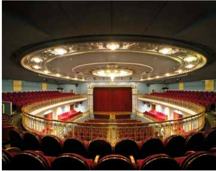
Interior del Teatro Bellas Artes de Tarazona.