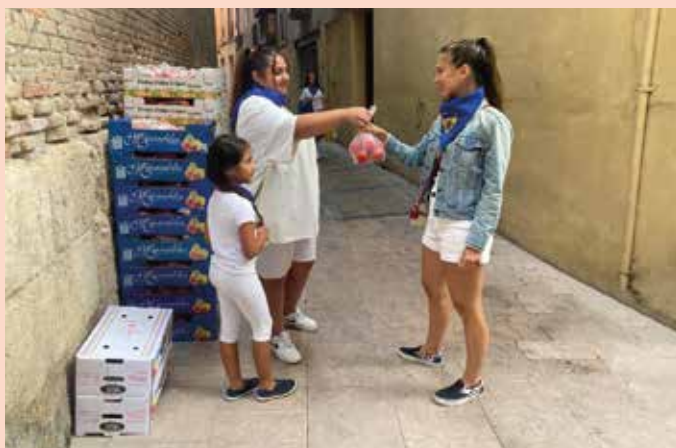
La mañana del día 27 el Ayuntamiento repartió 5.000 kg de tomates.