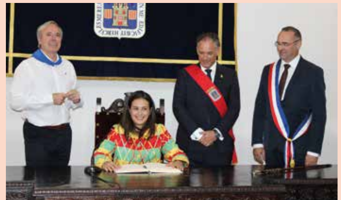
La Cipotegado firmó en el libro de honor del Ayuntamiento con las autoridades.