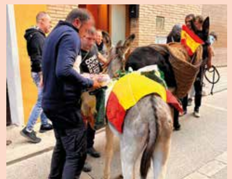
San Miguel realizó su recogida de dulces.