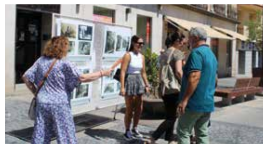
La exposición de fotos antiguas por diferentes zonas.