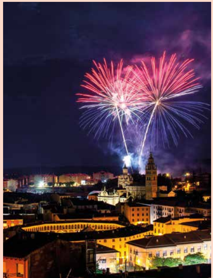
Los fuegos artificiales despidieron los festejos patronales. (JUAN VILLAREJO)