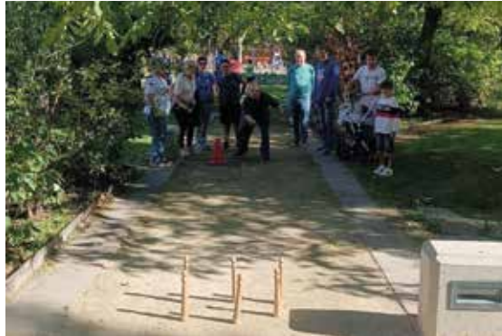
Deporte inclusivo para inaugurar la programación.

Es una iniciativa que refuerza el nombramiento de Tarazona como Villa Europea del Deporte 2024. “Es una forma de fomentar el ejercicio físico y de demostrar por qué somos Villa Europea del Deporte 2024, y qué mejor manera de prepararnos para ese año 2024, que va a ser intenso deportivamente, que participando en esta semana donde hemos organizado actividades para todos