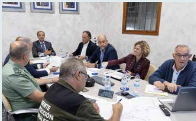
Reunión de autoridades en Tarazona el día 25.

También se han suministrado casi 1.000 litros de agua embotellada a los cuatro colegios y la Escuela Infantil Municipal, que cuentan con comedor escolar. Desde Cruz Roja Tarazona, han repartido más de 600 litros de agua a familias y vecinos vulnerables de la localidad.