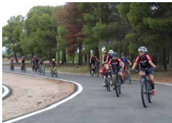
Miembros del CC Turiaso dieron las vueltas inaugurales al circuito.