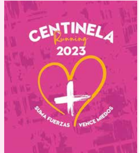
La marea rosa lucirá este emblema en sus camisetas.

La Centinela Running Kids es una camiseta de edición especial para los más pequeños con tallas de 2 a 14 años. Hasta el 20 de septiembre fue posible reservarla y la iniciativa fue todo un éxito ya que los niños forman parte de esta cita solidaria de una manera importante. Son muchas las familias que participan cada año, pero también los centros educativos y las escuelas deportivas movilizan a los pequeños para asistir a esta cita solidaria.