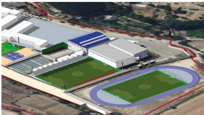
Infografía con el aspecto que presentará el polideportivo tras las obras.

Las obras para acondicionar el campo de fútbol municipal fueron adjudicadas el pasado 21 de septiembre, con comienzo inmediato y plazo de ejecución de un mes. Se posibilita así que la Sociedad Deportiva Tarazona pueda disputar al fin los partidos como local de 1ª RFEF ante la totalidad de la afición rojilla.