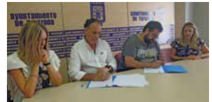
Firmando el convenio que destinará 15.000 euros para Cruz Roja.

El segundo proyecto al que irá destinada la subvención es el de ‘Promoción del Éxito Es-