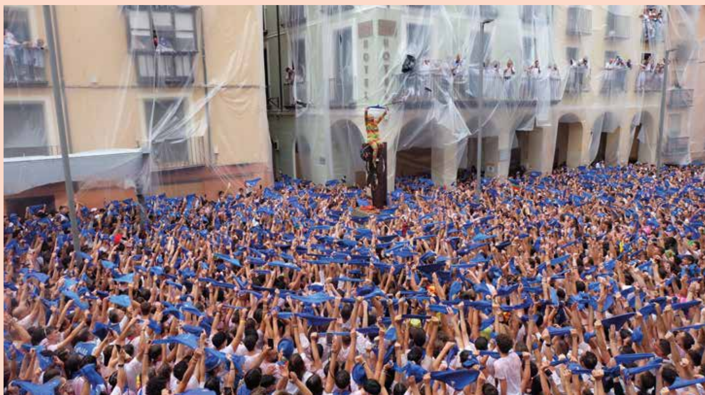
La marea roja se convirtió en azul cuando el público alzó sus pañuelos.