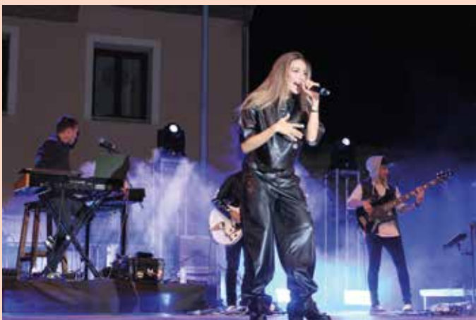
Ana Guerra ofreció un bonito espectáculo en Tarazona.