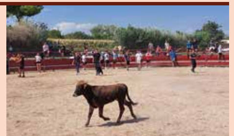
Suelta de becerras en Tórtoles. (PEÑA TAURINA)

Al cierre de esta edición San Miguel se encontraba en el ecuador de sus festejos y el barrio de Cunchillos estaba a punto de comenzar los suyos.