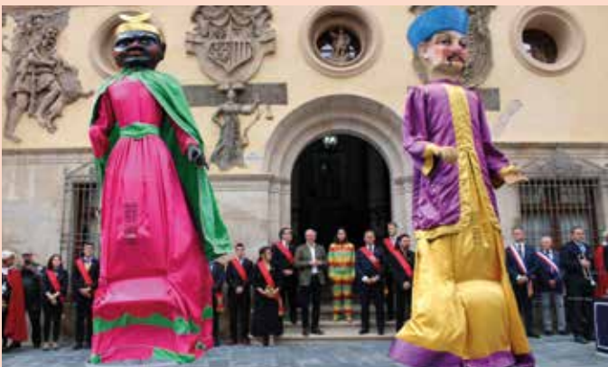
Los gigantes bailaron durante el homenaje a la Cipotegado.