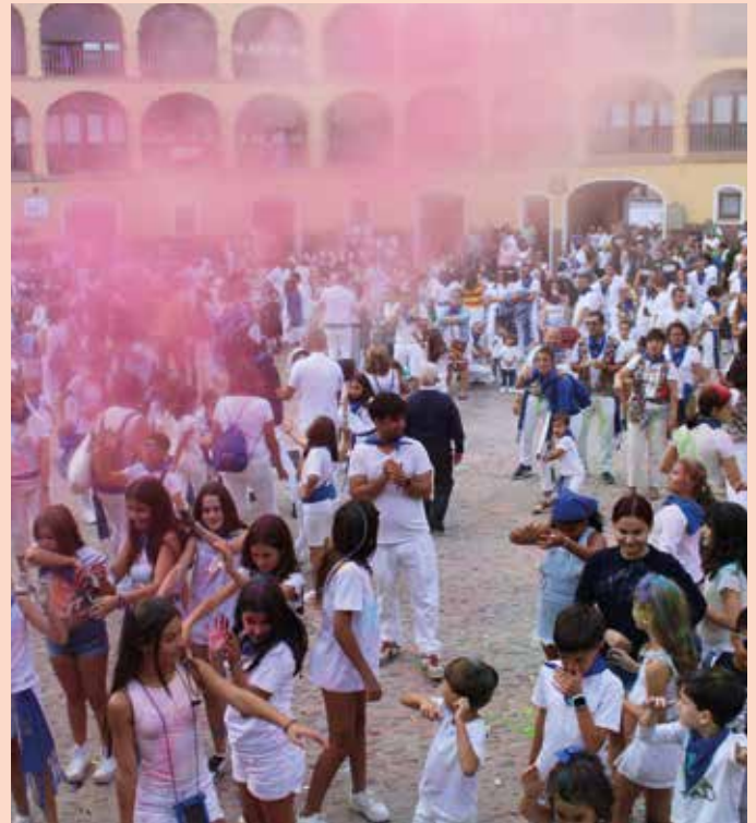
La música, el baile y los polvos de colores hicieron disfrutar en la fiesta holly.