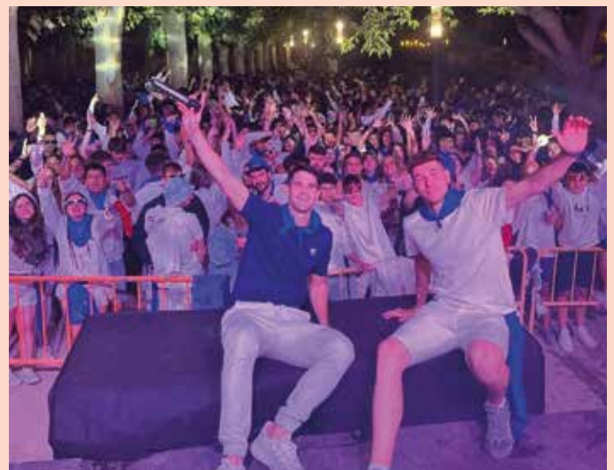
La comida de los jóvenes culminó con una sesión de dj's. (BENDITA JUVENTUD)