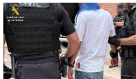
Uno de los siete detenidos durante el 27 de agosto.

Se lograron recuperar 34 teléfonos móviles, dos carteras y 380 euros que los presuntos autores ocultaban entre sus ropas. Uno de los detenidos portaba una faja ceñida al torso donde ocultaba 14