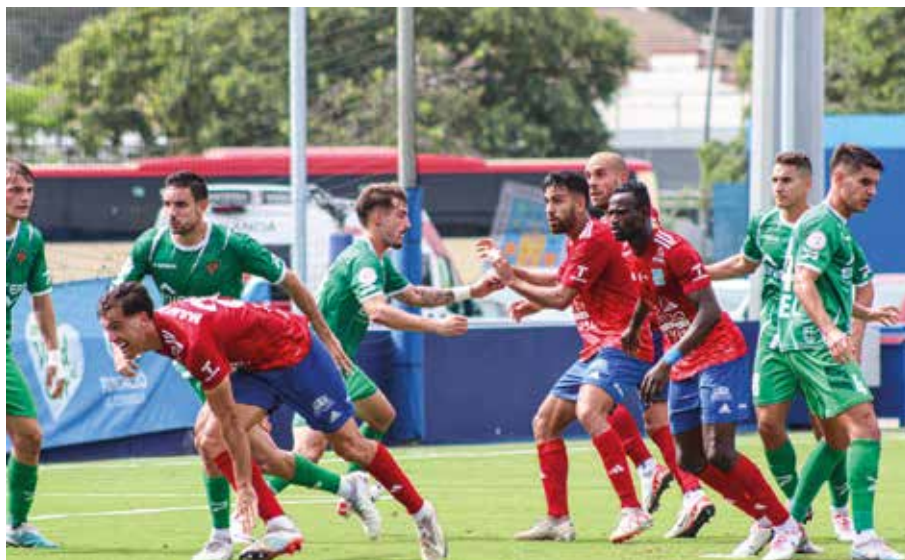
Imagen correspondiente al partido contra el Cornellà.

Una semana después llegó el primer punto para el conjunto tarazonense con un empate sin goles como locales en el Ciudad de Tudela ante el CyD Leonesa, con 897 aficionados roji-