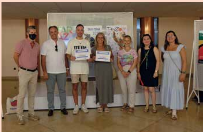
Entrega de premios del concurso del cartel de las fiestas.