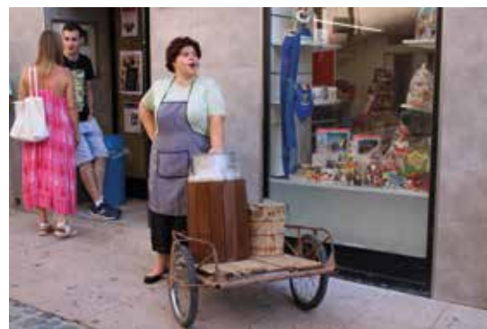
Helados de hace décadas gracias a la ambientación preparada.