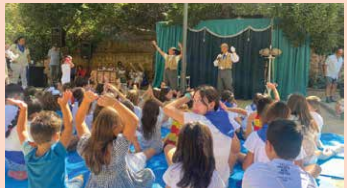
La mezcla de teatro infantil y circo gustó a los más pequeños.