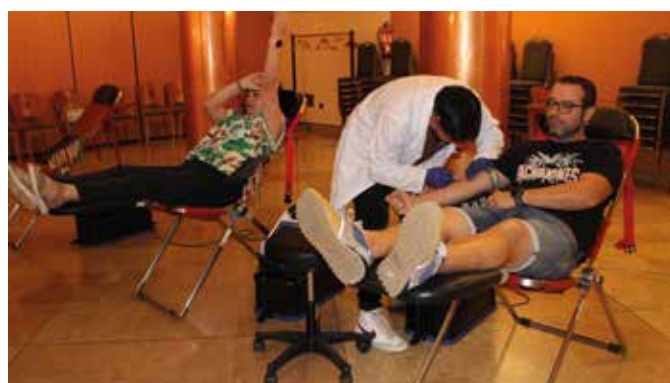
Dos vecinos realizan su donación en el Centro de Mayores.

Afortunadamente, la sociedad turiasonense se ha volcado siempre con las donaciones de sangre y para comprobarlo sólo había que ver las personas que esperaban su turno para la extracción.