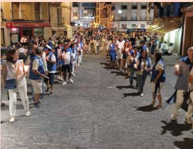
Desfile de luminarias para encender la hoguera del Sapo.