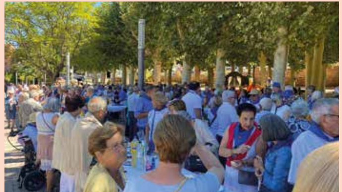
Los mayores disfrutaron de su tradicional vermouth en Pradiel.