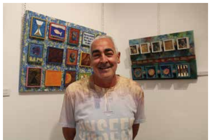
El autor posa delante de algunas de sus obras.

Sus obras combinan elementos de la naturaleza, así animales y vegetación están repre-