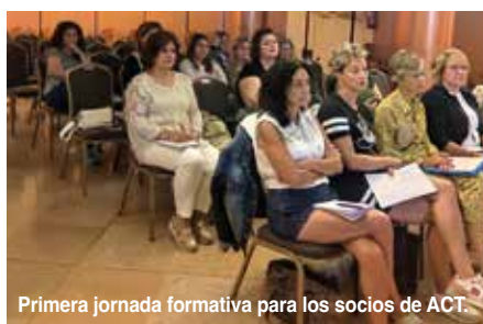
Primera jornada formativa para los socios de ACT.

"Este ciclo formativo trata un tema muy interesante como es el marketing digital, que es un mundo lleno de posibilidades. En la primera sesión hubo más de una veintena de partici-