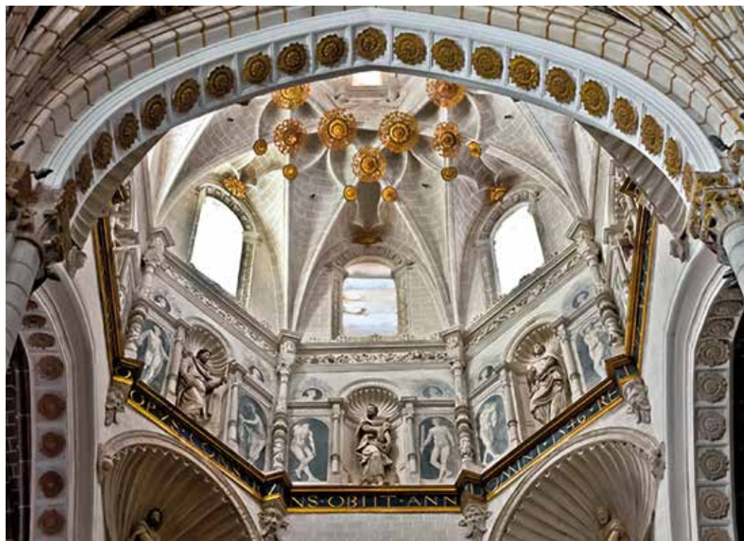
Las grisallas de la catedral, una joya renacentista y única.

En el siglo XVI Tarazona experimentó un importante desarrollo económico y alcanzó relevancia política y religiosa. La ciudad comenzó a expandirse hacia la margen derecha del río y alrededor de la catedral, donde las familias más adineradas levantaron sus residencias. En el plano artístico, importantes mecenas y artistas, como el pintor italiano Pietro Morone, afincado en la comarca del Moncayo, o Alonso González elevaron a Tarazona como una ciudad pionera en