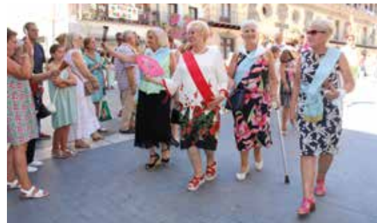
Las homenajeadas saludaron emocionadas durante el desfile.