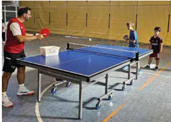
Mayores y pequeños se interesaron por el tenis de mesa.

los públicos, los más pequeños, más mayores, los que quieren competir o personas con discapacidad”, explica Pablo Escribano, concejal de Deportes.