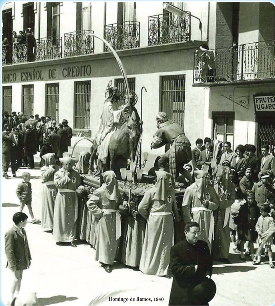
Domingo de Ramos, 1940