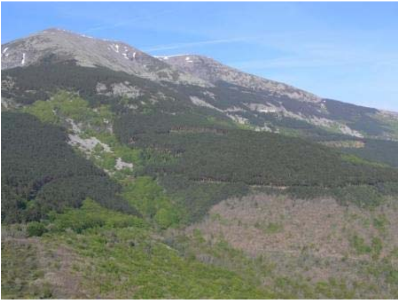
Vista del Moncayo desde el Cabezo de la Mata.

Un claro del bosque nos deja ver el paisaje por un momento, hasta llegar, en algo más de un kilómetro de esta pista, a un cortafuegos entre pinos silvestres. Hay aquí una señal indicadora que señala el camino a seguir (4).