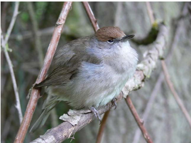
Hembra de curruca capirotada. (Foto MMF).

El cortafuegos desciende rápidamente, por un camino cómodo y fácil de andar, hasta el collado de Juan Abarca (5), punto en el que se cruza con una pista forestal más marcada y de uso más frecuente. Hemos descendido cien metros y tenemos enfrente el Cabezo de la Mata, uno de los montes de silueta más característica de todo el macizo.