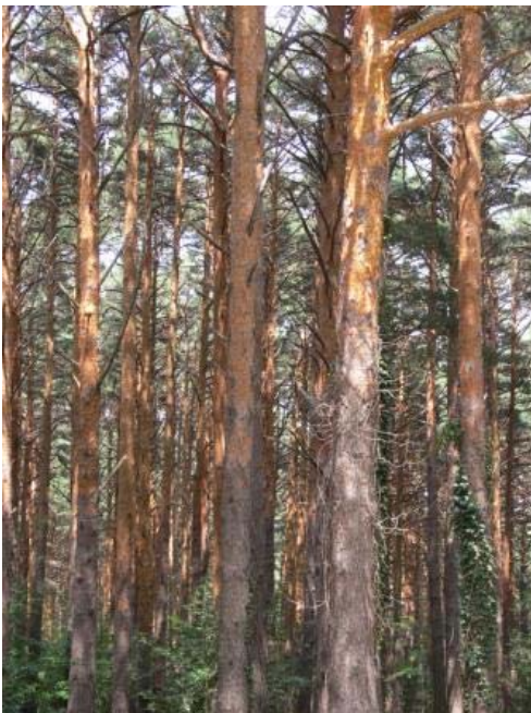
Los rojizos fustes del pino silvestre dan una nota más de color a los bosques del Moncayo.

A nuestra derecha, la pista desciende en altitud hasta llegar al cruce con el barranco de Morca. Las hayas que vemos ahora delatan una mayor frescura. Aquí, las aguas del Moncayo, nacidas en el circo de Morca, descienden desde la fuente del Morroncillo hasta este rincón, para proseguir naturalmente por el barranco o para encauzar su curso por una acequia que discurre paralela a la pista forestal, que, poco a poco, nos acompaña en nuestro itinerario por una fresca umbría poblada de hayas. Es el hayadal de Añón.