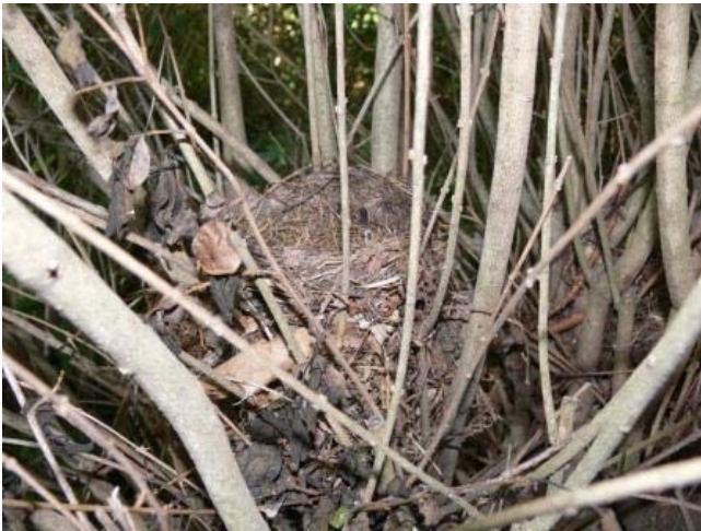
Nido de mirlo común, oculto entre la maleza.

A nuestra derecha, la pista desciende en altitud hasta llegar al cruce con el barranco de Morca. Las hayas que vemos ahora delatan una mayor frescura. Aquí, las aguas del Moncayo, nacidas en el circo de Morca, descienden desde la fuente del Morroncillo hasta este rincón, para proseguir naturalmente por el barranco o para encauzar su curso por una acequia que discurre paralela a la pista forestal, que, poco a poco, nos acompaña en nuestro itinerario por una fresca umbría poblada de hayas. Es el hayadal de Añón.